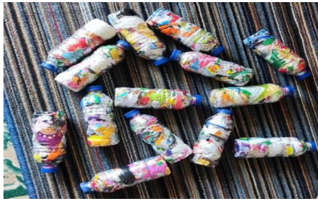
Gambar 3. Hasil Ecobrik Desa Ngadisalam

Pada gambar 1 menunjukkan aktivitas perihal memberikan sosialisasi kepada masyarakat terkait bagaimana memanfaatkan sampah yang ada, serta juga memiliki nilai ekonomis. Dengan hal tersebut memberikan pemahaman kepada masyarakat bahwa sampah juga memiliki nilai ekonomis. Pada gambar 2 adalah aktivitas perihal tim memperagakan bagaimana pengolahan sampah yang bisa dijadikan ecobrik. Kegiatan tersebut dihadiri oleh masyarakat Desa Ngadisalam Kabupaten Wonosobo untuk melihat secara langsung bagaimana proses dari pembuatan ecobrik yang ada. Terakhir gambar 3 adalah hasil dari beberapa ecobrik yang dilakukan oleh masyarakat Ngadisalam Kabupaten Wonosobo.