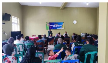
Gambar 1. Sosialisasi Pemanfaatan Sampah kepada Masyarakat

Pada perencanaan tahap awal tim mengajak masyarakat untuk membuat ecobrik dengan tujuan untuk membuat gapura yang nantinya akan diserahkan kepada masing-masing dusun yang ada di Desa Ngadisalam. Kegiatan pelatihan dan sosialisasi terkait pemanfaatan sampah menjadi ecobrik cukup diminati oleh masyarakat dilihat dari kehadiran dan keaktifan masyarakat saat mengikuti sosialisasi yang ada. Untuk lebih jelas dapat dilihat pada gambar dibawah ini;