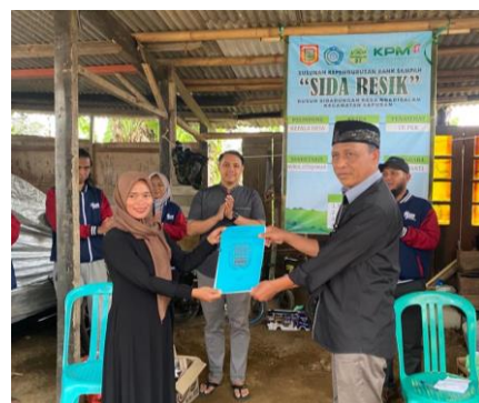
Gambar 6. Penyerahan SK Bank Sampah dari Kepala Desa Ngadisalam

Pada gambar 5 adalah satu bukti komitmen perihal bagaimana Bank sampah ini akan dikelola dengan baik oleh masyarakat Ngadisalam, dengan mengadakan pembentukan kepanitiaan dan launching secara resmi Bank Sampah Ngadisalam Kabupaten Wonosobo resmi diberinama “Bank Sampah Sida Resik” yang dihadiri langsung oleh Kepala Desa Ngadisalam. Untuk Gambar 6 merupakan penyerahan Surat Keputusan (SK) pengelola Bank Sampah Sida Resik yang dilakukan langsung oleh Kepala Desa dan diterima oleh ketua pengurus Bank Sampah Sida Resik. Dengan adanya penyerahan SK membuktikan bahwa pengelolaan Bank Sampah Sida Resik Desa Ngadisalam akan dikelola secara professional dengan melibatkan banyak masyarakat.