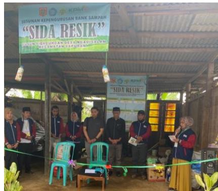
Gambar 5. Pembentukan dan launching Bank Sampah

Manajemen pengelolaan Bank Sampah harus bisa dijalankan dengan cara professional agar nantinya bisa tertata dengan baik (Azizah & Rohyani, 2022). Maka dari tim perlu rasanya membentuk kepengurusan yang jelas terkait Bank Sampah yang nantinya akan berjalan di Desa Ngadisalam Kabupaten Wonosobo ini. pembentukan kepengurusan harus bekerjasama dengan Kepala Desa yang memiliki hak untuk membuat Surat Keputusan (SK) secara resmi. Selain itu juga sekalian adanya peresmian terkait nama Bank Sampah yang ada di Desa Ngadisalam Kabupaten Wonosobo. Untuk lebih jelas dapat dilihat pada gambar dibawah ini;