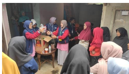
Gambar 2. Sosialisasi Pembuatan Ecobrik kepada Masyarakat