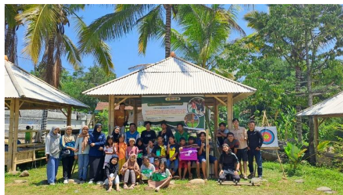
Gambar 7. Grand opening permainan ghir sungai

Dampak pariwisata terhadap kondisi Pitana (2009) mengemukakan bahwa ekonomi dikategorikan dalam 8 kategori seperti berikut: 1. Dampak terhadap penerimaan devisa 2. Dampak terhadap pendapatan masyarakat 3. Dampak terhadap kesempatan kerja 4. Dampak terhadap distribusi manfaat atau keuntungan 5. Dampak terhadap kepemilikan dan kontrol (ekonomi) masyarakat. 6. Dampak terhadap pembangunan pada umumnya 7. Dampak terhadap pendapatan pemerintah Sport tourism adalah pariwisata olahraga yang mengacu pada pengalaman perjalanan yang terlibat dalam kegiatan olahraga (Stephen, 2011).