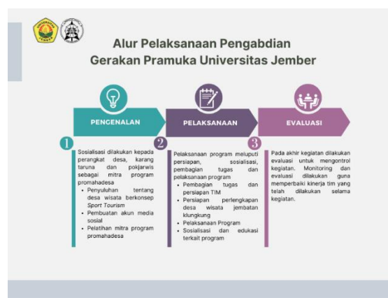
Gambar 1. Alur Pelaksanaan Promahadesa

Metode pelaksanaan program terbagi menjadi tiga yaitu tahap pengenalan, tahap pelaksanaan, serta tahap evaluasi. Ketiga tahapan tersebut disajikan dalam diagram alur pelaksanaan program sebagai berikut: