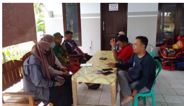
Gambar 2. Koordinasi dengan perangkat desa dan karang taruna

Program Promahadesa Tahun 2023 dimulai dengan melakukan survei di Desa Klungkung dengan hasil yang menunjukkan bahwa masyarakat di desa tersebut masih bergantung dengan hasil pertanian. Masyarakat kurang menyadari kondisi alam yang dimiliki Desa Klungkung untuk meningkatkan perekonomian desa. Faktanya, desa tersebut berpotensi untuk membangun Wisata Jembatan Klungkung berkonsep sport tourism. Realisasi program ini diawali dengan dilaksanakannya sosialisasi untuk memperkenalkan desa wisata berbasis sport tourism sehingga masyarakat memiliki pengetahuan dan kesadaran akan potensi yang dapat dikembangkan oleh desa tersebut. Pelaksanaan Program Promahadesa Tahun 2023 dengan judul “Pengembangan Desa Wisata Berkonsep Sport Tourism Dalam Rangka Pemberdayaan Masyarakat Di Desa Klungkung, Kecamatan Sukorambi, Kabupaten Jember” diawali dengan melaksanakan sosialisasi kepada POKDARWIS Kencana Putih dan karang taruna setempat mengenai potensi wisata yang dapat dikembangkan di desa tersebut.