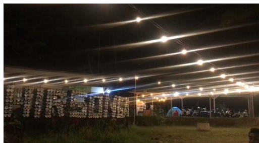
Gambar 3. Wisata ghir songai yang telah terbentuk

Tempat pengabdian pelaksanaan kegiatan ini dilakukan di Desa Klungkung, Sukorambi, Kabupaten Jember selama bulan Juli – November 2023. Pengembangan yang dilakukan berfokus pada wisata jembatan klungkung dengan mengembangkan wahana yang dapat menarik masyarakat sekitar untuk berwisata. Hasil dari kegiatan pengabdian ini adalah adanya desa wisata berbasis sport tourism guna meningkatkan kesadaran berwisata, adanya pengadaan lapangan permainan tradisional yang memiliki tujuan untuk mengenalkan permainan tradisional kepada masyarakat agar tidak lupa kebudayaan dan memiliki lahan bermain permainan tradisional. Saat ini telah memiliki taman bernama “Gir Songai” yang mana dalam taman tersebut sudah terdapat beberapa taman dan tempat duduk yang terletak di sebelah sungai. Taman ini juga memiliki fasilitas yang kita kembangkan berupa adanya lahan untuk permainan tradisional. Alat permainan tradisional yang ada yakni panahan, egrang dan bakiak.