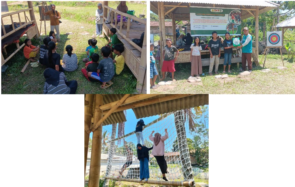
Gambar 6. Kegiatan lomba

Dampak pariwisata terhadap kondisi Pitana (2009) mengemukakan bahwa ekonomi dikategorikan dalam 8 kategori seperti berikut: 1. Dampak terhadap penerimaan devisa 2. Dampak terhadap pendapatan masyarakat 3. Dampak terhadap kesempatan kerja 4. Dampak terhadap distribusi manfaat atau keuntungan 5. Dampak terhadap kepemilikan dan kontrol (ekonomi) masyarakat. 6. Dampak terhadap pembangunan pada umumnya 7. Dampak terhadap pendapatan pemerintah Sport tourism adalah pariwisata olahraga yang mengacu pada pengalaman perjalanan yang terlibat dalam kegiatan olahraga (Stephen, 2011).