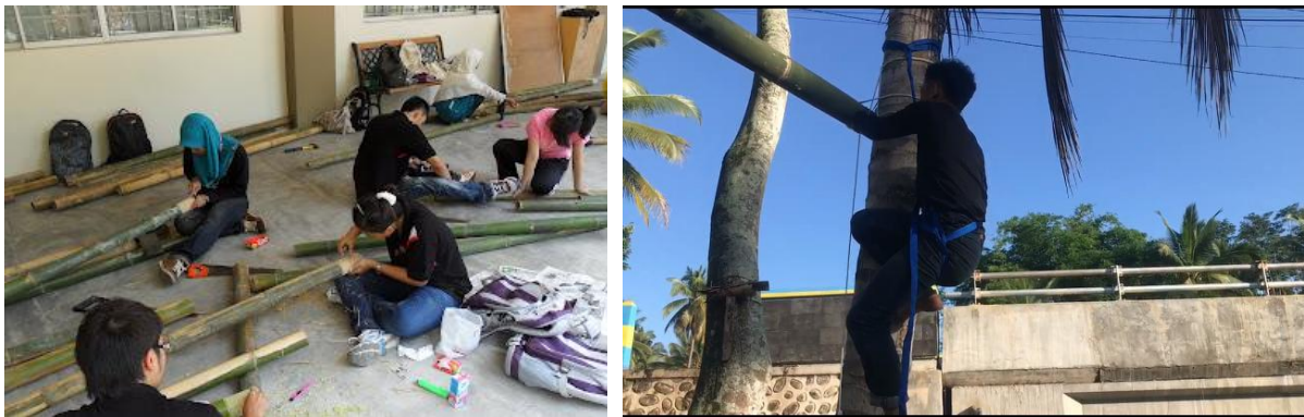
Gambar 5. Pembuatan dan pemasangan permainan

Pada Desa Klungkung ini pengembangan desa wisata yang dilakukan mengacu pada pengembangan desa wisata berkonsep sport tourism dengan menyisipkan permainan tradisional yang dapat meningkatkan kesadaran pariwisata masyarakat hingga dapat meningkatkan pengembangan ekonomi akibat adanya wisata. Ekonomi Masyarakat Wisata yang datang ke Wisatawan sebuah destinasi dalam jangka waktu tertentu, menggunakan sumber daya dan fasilitasnya. Biasanya mengeluarkan uang untuk keperluan tertentu, kemudian meninggalkan tempat tersebut untuk kembali ke negaranya. "Jika wisatawan yang datang ke sebuah destinasi tersebut sangat banyak akan berdampak pada kehidupan ekonomi daerah tersebut, baik langsung maupun tidak langsung. Dampak ekonomi yang ditimbulkan dapat bersifat positif maupun negatif" (I. G. Pitana dan Putu, 2009).