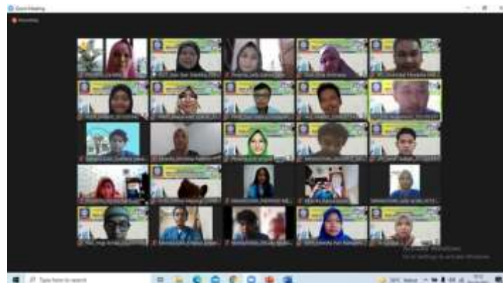
Gambar 7. Tanya Jawab Pada Pengabdian Masyarakat “Penyuluhan Selektivitas Pesan Media Sosial Terhadap Kaum Wanita Di Lingkungan RT 03 RW 14 Babelan Kabupaten Bekasi”

Respon baik akan diperoleh manakala akal budi serta seperangkat naluri yang dimiliki oleh pengguna bekerja dengan baik. Selanjutnya akan kembali lagi seperti langkah awal yakni komunikan mempertimbangkan konten yang diterimanya. Ia merujuk atau bereferensi dengan falsafah hidupnya, konsep kebahagiaannya, serta seperangkat nilai yang dimilikinya.