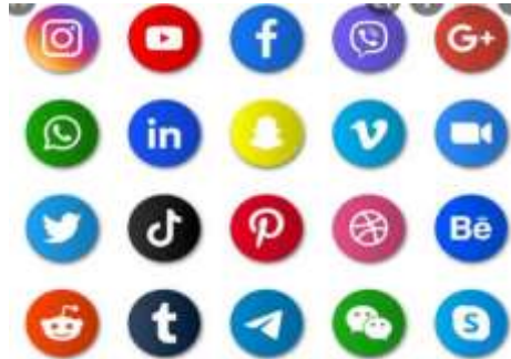
Gambar 2. Varian Media Sosial

media sosial berasal dari adanya interaksi para penggunanya ( user ), sedangkan kata media berasal dari platform yang memungkinkan terjadinya interaksi tersebut bisa terwujud. Media sosial bisa dipahami sebagai bentuk komunikasi elektronik seperti situs web untuk jejaring sosial dan microblogging yakni ketika penggunanya membuat komunitas online untuk berbagi informasi, ide, pesan pribadi, dan konten lainnya seperti halnya video (Saxena, 2017).