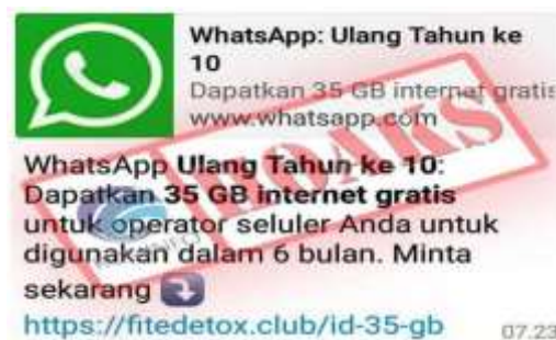
Gambar 3. Pesan Jebakan Spam

Salah satu contoh yang terjadi ketika ada pesan WhatsApp yang tiba-tiba masuk. Sebenarnya pesan ini masuk kategori jebakan. Namun tidak banyak yang tahu. Akibatnya tidak sedikit warga yang terkena spam alias pesan iklan yang akan mengganggu aktifitas komunikasi. Bahkan bisa merusak sistem yang ada pada perangkat. Peristiwa ini terjadi nyata dan diberitakan oleh media Jabar News dengan link berita https://jabarnews.com/read/102175/awas-jebakan-situs-palsu-yang-tersebar-di-whatsapp-ini-cara-membedakannya/1 .