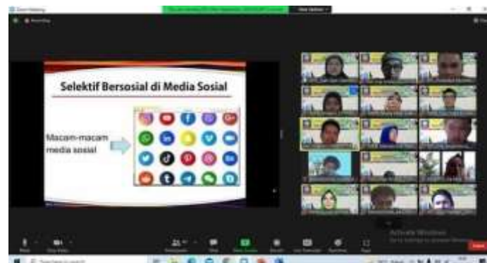
Gambar 5. Penyampaian Materi Pada Pengabdian Masyarakat Secara Online Melalui Aplikasi Zoom Meet .

Sebagaimana dengan judul Pengabdian Masyarakat ini, maka hadirnya media sosial yang berbasis web mengubah komunikasi dengan beberapa cara key . Media massa tradisional pada dasarnya menawarkan model komunikasi "satu untuk banyak". Sedangkan media sosial memberikan model tambahan yakni, "banyak untuk satu" (satu akun bisa berkomunikasi ke banyaknya pengguna yang berinteraksi dengan aplikasi media sosial tersebut).