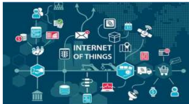
Gambar 4. Skema Internet Of Thing

ada komunikator yang mengirimkan pesan dan ada komunikator yang menerima pesan (Cahyono, 2019). Namun, ketika kita melihat mereka secara lebih rinci, beberapa fundamental berubah.