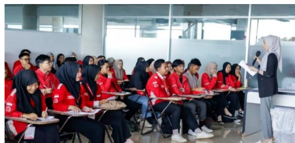
Gambar 1. Penyampaian Materi Penulisan Karya Ilmiah

Pelaksanaan kegiatan dilaksanakan selama 1 (satu) hari, dimana pada hari pertama dilakukan registrasi peserta, pengisian pernyataan atau pre-test mengenai pengetahuan awal peserta akan penulisan karya ilmiah, pembukaan, dan pelaksanaan kegiatan pelatihan penulisan karya tulis ilmiah.