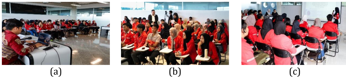
Gambar 2. (a) Peserta menyimak materi (b) Tanya jawab (c) Presentasi artikel

Pelatihan ini juga menjelaskan kaidah-kaidah penulisan karya ilmiah baik secara umum maupun secara khusus. Hal yang paling penting adalah menjelaskan dengan rinci struktur dari karya ilmiah. Materi terakhir menjelaskan dengan singkat bagaimana membuat sitasi atau kutipan yang benar.