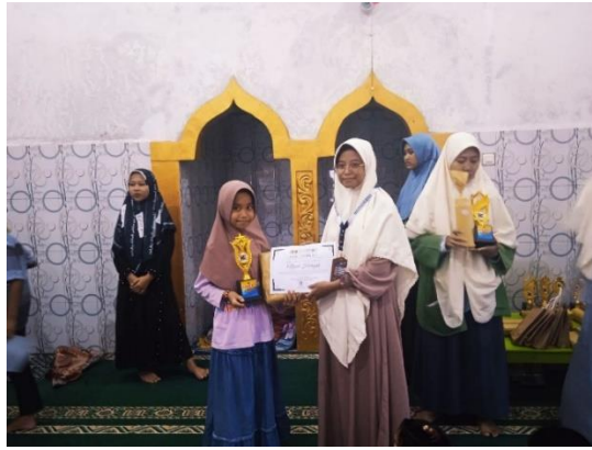
Gambar 4. Pembagian hadiah kepada para pemenang