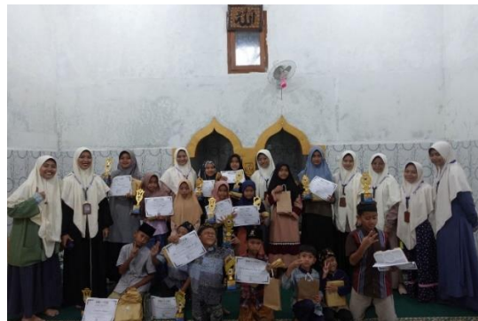
Gambar 5. Hari kedua perfotoan pembagian hadiah dan sertifikat kepada seluruh peserta