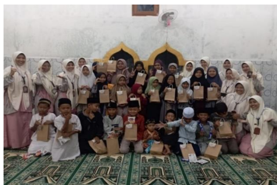
Gambar 3. Hari pertama perfotoan bersama panitia dan peserta lomba semarak literasi Qur’an