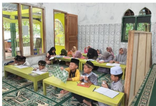
Gambar 2. Proses belajar mengajar di TPA Latansa