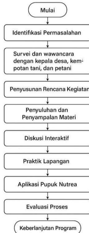
Gambar 2. Diagram Alur Kegiatan Pengabdian Masyarakat

Metode pelaksanaan ini mendukung tujuan Sustainable Development Goals (SDGs) ke-4 ( Quality Education ) dan ke-17 ( Partnerships for the Goals ), karena mengedepankan transfer pengetahuan, kolaborasi antara perguruan tinggi, pemerintah desa, dan masyarakat, serta pemberdayaan petani sebagai pelaku utama pembangunan pertanian berkelanjutan.