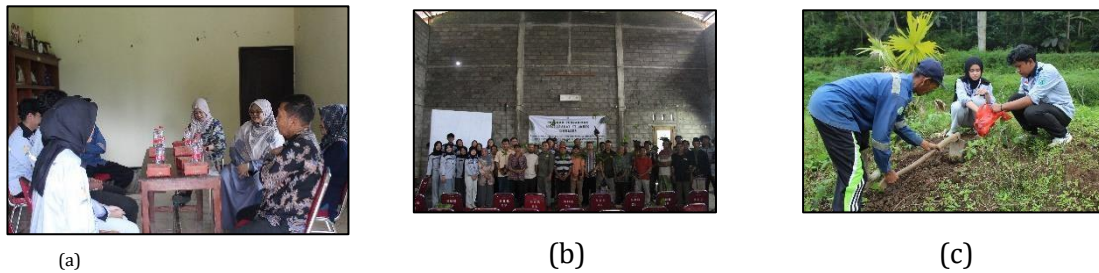
Gambar 3. Pelaksanaan kegiatan pengabdian (a) koordinasi pra pelaksanaan antara tim dan desa mitra (b) penyampaian materi (c) praktik materi

Kegiatan pengabdian kepada masyarakat yang dilaksanakan di Desa Sumberahayu telah memberikan berbagai hasil yang cukup signifikan, baik dari aspek pengetahuan, keterampilan, inovasi, maupun dampak sosial dan ekonomi masyarakat tani. Program ini menjadi sarana nyata untuk menghubungkan hasil riset dan pengetahuan akademik dengan praktik pertanian di lapangan, sehingga mampu menjawab kebutuhan riil petani dalam meningkatkan produktivitas sekaligus menjaga keberlanjutan lingkungan pertanian.