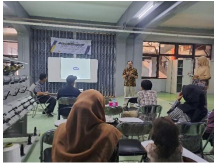
Gambar 2. Pemaparan identifikasi serat oleh pemateri 1

Ada beberapa metode untuk mengidentifikasi serat yaitu cara pembakaran, cara pelarutan, dan mikroskop. Untuk cara pembakaran, serat-serat baik alam maupun serat sintetis serta serat campuran, akan memberikan asap, bau, dan hasil pembakaran yang berbeda-beda. Sesi pemaparan materi 1 ini dibantu menggunakan laptop dan LCD. Selain menampilkan PPT berupa materi, pemateri juga menampilkan video-video terkait pengolahan limbah kain majun baik skala nasional maupun internasional. Diharapkan dengan video tersebut, peserta terpicu untuk melakukan pengolahan limbah kain majun di konveksi mereka sendiri.