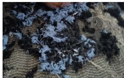
Gambar 6. Hasil pencacahan limbah majun di BBSPJI Tekstil