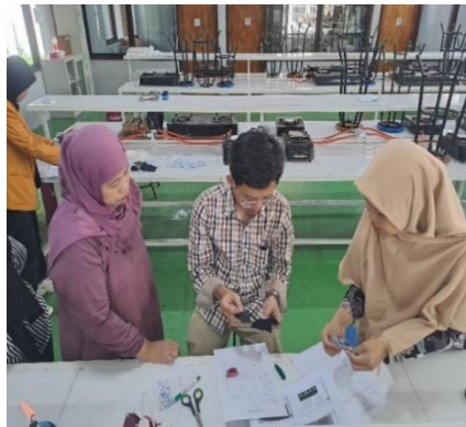
Gambar 3. Peserta sedang mempersiapkan percobaan identifikasi serat

Ada beberapa metode untuk mengidentifikasi serat yaitu cara pembakaran, cara pelarutan, dan mikroskop. Untuk cara pembakaran, serat-serat baik alam maupun serat sintetis serta serat campuran, akan memberikan asap, bau, dan hasil pembakaran yang berbeda-beda. Sesi pemaparan materi 1 ini dibantu menggunakan laptop dan LCD. Selain menampilkan PPT berupa materi, pemateri juga menampilkan video-video terkait pengolahan limbah kain majun baik skala nasional maupun internasional. Diharapkan dengan video tersebut, peserta terpicu untuk melakukan pengolahan limbah kain majun di konveksi mereka sendiri.