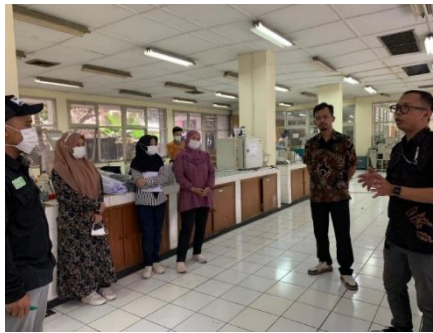
Gambar 5. Kegiatan pemaparan pengolahan limbah majun dari hulu ke hilir yang berkolaborasi dengan BBSPJI Tekstil

Materi kedua yaitu edukasi pengolahan limbah kain majun dari hulu ke hilir dengan pendekatan ekonomi sirkular. Pada Gambar 5 dan 6 terlihat proses berlangsungnya pemaparan dari fasilitator Unit Fasilitasi Kemitraan Industri BBSPJI Tekstil. Peserta diberikan kesempatan untuk melakukan simulasi proses pencacahan kain majun menjadi serat-serat kecil sebagai tahap awal proses recycling. Selanjutnya, peserta diperkenalkan dengan berbagai contoh produk hilir alternatif yang dapat dihasilkan dari serat majun yang telah tercacah, seperti benang daur ulang (recycled yarn), kain nir-tenun (nonwoven), dan produk turunan lain seperti alas kaki, insulator, atau material ramah lingkungan. Pada sesi ini, peserta diberi pemahaman mengenai alur nilai tambah (value chain) limbah kain majun sehingga peserta mampu melihat peluang pengembangan produk kreatif yang memiliki potensi ekonomi.