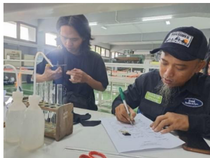
Gambar 4. Peserta sedang melakukan percobaan identifikasi serat dengan cara pembakaran dan pelarutan.

Masih dalam rangkaian materi pertama, selanjutnya adalah percobaan identifikasi serat tekstil secara langsung dengan metode pembakaran dan pelarutan. Untuk percobaan ini diarahkan oleh seorang instruktur dan mahasiswa dari Politeknik STTT Bandung seperti terlihat pada Gambar 3. Percobaan identifikasi serat ini dibagi menjadi 3 kelompok sesuai dengan konveksi masing-masing. Pada percobaan identifikasi serat ini menggunakan prosedur sesuai modul Praktikum Serat Tekstil (Komalasari & Umam, 2013). Percobaan menggunakan kain langsung sebagai sampelnya. Ada 8 jenis kain yaitu kain rayon, kain katun, kain polyester, kain sutera, kain T/C, kain T/R, kain wool, dan kain limbah majun dari konveksi masing-masing. Kain