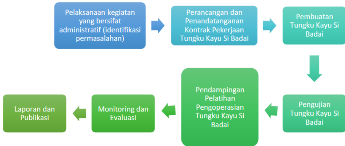
Gambar 1. Tahapan Pelaksanaan Program Pengabdian kepada Masyarakat Adapun tahapan kegiatan Program Pengabdian Kepada Masyarakat, meliputi :

Identifikasi dilakukan melalui koordinasi dengan Masyarakat, periset dari BRIN dan pelaksana kegiatan untuk mengetahui permasalahan-permasalahan yang terjadi di Masyarakat.