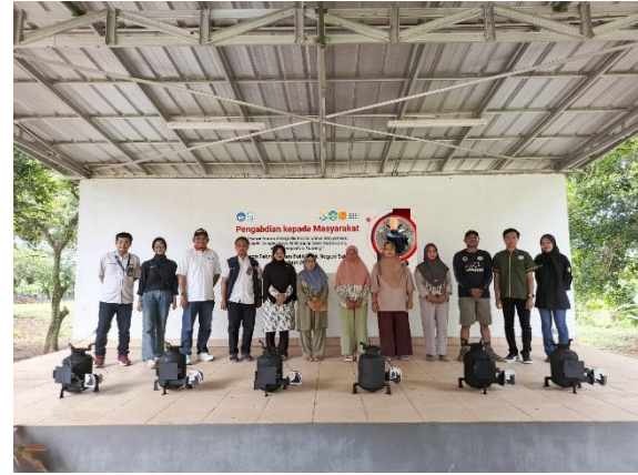
Gambar 3. Pelatihan Dan Pendampingan Menggunakan Tungku Si Badai Pada proses pelatihan peserta pelatihan terlibat dalam beberapa proses kegiatan:

Para peserta diberikan pengarahan tentang bahan apa aja yang dapat digunakan sebagai bahan bakar. Peserta pelatihan melakukan pemilihan bahan yang sudah disiapkan oleh tim. Peserta mampu mengidentifikasi berupa sampah plastik dan kayu baik kering maupun basah dan menyisihkan besi. Hal ini membuktikan bahwa peserta mampu mengidentifikasi dengan baik.