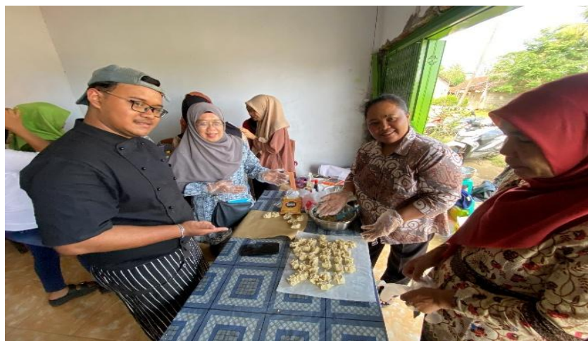
Gambar 4. Proses Pembuatan Produk

Seluruh proses pelatihan dilakukan secara berkelompok bersama Bapak Ibu Dosen Tim Pengabdian serta beberapa mahasiswa yang ikut terlibat dalam tahapan ini. Adapun secara garis besar langkah-langkah teknis yang dilakukan meliputi pemilihan bahan baku yang akan digunakan sebagai bahan uji coba di laboratorium Tata Boga Universitas Negeri Malang, praktik pembuatan produk sebelum dilakukan pelatihan kepada warga Desa Wonosari, pelaksanaan pengabdian dengan memberikan pelatihan pengolahan produk kepada masyarakat, serta pengemasan dan pelabelan dengan menggunakan kemasan plastik serta label nama produk yang telah diakomodasi oleh tim pengabdian. Pendekatan partisipatif dalam pelatihan ini sejalan dengan temuan Pasaribu et al. (2023) yang menyatakan bahwa pelatihan menu olahan ikan dapat meningkatkan ketahanan pangan lokal melalui transfer pengetahuan dan keterampilan kepada masyarakat.