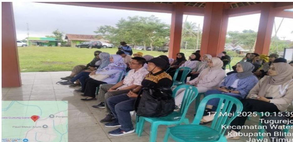
Gambar 2. Koordinasi Tim Pengabdian dengan Pemerintah Desa

Kegiatan koordinasi meliputi beberapa aktivitas kunci, yaitu koordinasi dengan pemerintah desa sebagai mitra utama program, koordinasi dengan pelaku UMKM untuk menentukan produk yang relevan dan memiliki potensi pasar yang baik, belanja bahan baku untuk pembuatan produk uji coba, serta uji coba produk di laboratorium Tata Boga Universitas Negeri Malang sebelum didiseminasikan kepada masyarakat. Tahap koordinasi ini sangat krusial karena melibatkan pemangku kepentingan lokal yang memahami kondisi riil masyarakat. Pemanfaatan pangan lokal merupakan isu penting sebagai upaya peningkatan ketahanan pangan dan kesejahteraan bagi masyarakat (Bara et al., 2025). Lebih lanjut, pemanfaatan pangan lokal sebagai aset ekonomi dapat memberikan nilai tambah tinggi melalui pendekatan teknologi dan kewirausahaan (Bambang et al., 2023).