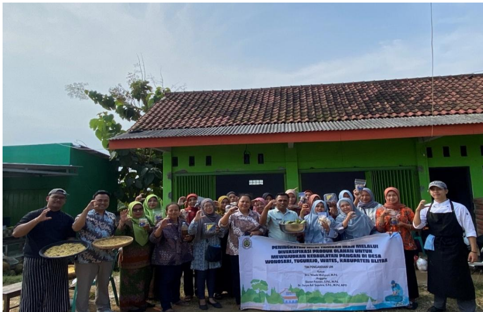
Gambar 7. Foto Bersama Masyarakat Desa Wonosari Setelah Pelaksanaan Kegiatan Pengabdian

kalah penting: meningkatnya kepercayaan diri peserta dalam berwirausaha, tumbuhnya kolaborasi antarwarga dalam proses produksi, serta munculnya inisiatif pembentukan kelompok usaha bersama. Dari sisi tantangan, pelaksanaan di lapangan menemui beberapa hambatan seperti keterbatasan fasilitas produksi skala rumah tangga, fluktuasi ketersediaan bahan baku ikan pada musim paceklik, dan tingkat literasi digital peserta yang beragam. Tantangan-tantangan ini menjadi pembelajaran berharga ( lesson learned ) untuk penyempurnaan program pengabdian serupa di masa mendatang.