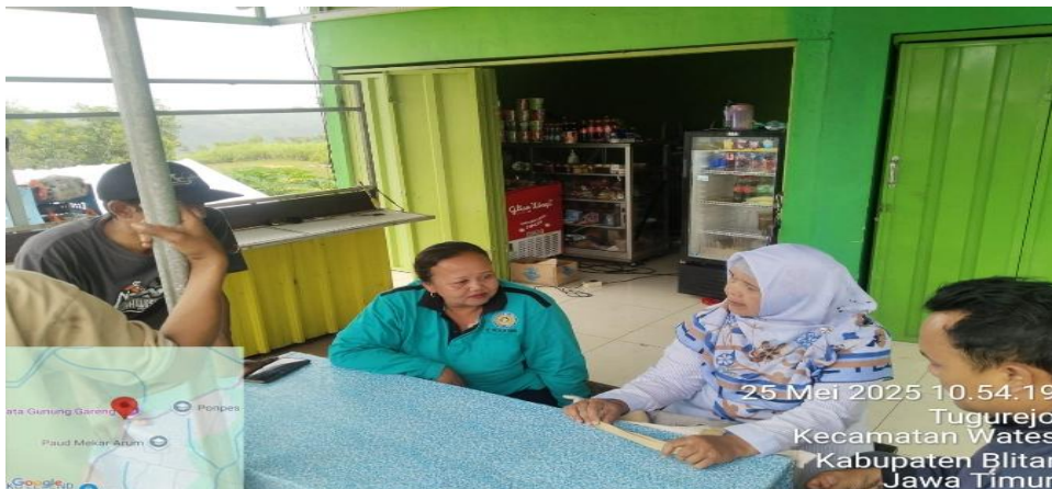
Gambar 3. Koordinasi Tim Pengabdian dengan UMKM

tepung ikan sebagai bahan utama. Produk ini menjadi solusi inovatif untuk mengoptimalkan hasil tangkapan ikan yang melimpah, terutama saat musim panen. Dimsum berbahan ikan memberikan nilai tambah karena dapat disimpan lebih lama dan memiliki harga jual yang lebih tinggi dibanding ikan segar. Brownie cookies merupakan inovasi cookies cokelat yang berbahan dasar tepung pisang dan tepung ikan, bertekstur renyah dan beraroma coklat dengan sentuhan ikan yang memberi keunikan pada produk. Kue satu sebagai camilan tradisional diinovasi dengan menggunakan tepung pisang sebagai bahan utama, menghasilkan tekstur renyah dengan aroma pisang yang khas. Banana muffin dipilih karena kesederhanaan proses pembuatannya yang tidak memerlukan mixer, menghasilkan tekstur lembut dengan rasa manis dan aroma pisang yang khas. Terakhir, tiwul pisang sebagai makanan khas Jawa diinovasi dengan menggunakan pisang yang sudah dikeringkan, menghasilkan tekstur yang mirip dengan tiwul pada umumnya.