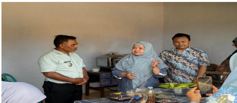
Gambar 6. Pelaksanaan Pelatihan

Tahap ketiga merupakan tahap pemasaran digital dan pengemasan yang menjadi aspek penting dalam memperluas jangkauan pasar dan meningkatkan nilai jual produk. Materi yang disampaikan meliputi pembuatan akun bisnis, teknik mengambil foto produk yang menarik dengan pencahayaan alami, strategi menulis caption promosi, serta cara menjawab pertanyaan calon pembeli secara profesional. Meskipun saat ini warga sudah mengenal cara pemasaran melalui WhatsApp maupun media sosial seperti Facebook, penting untuk mempelajari strategi pemasaran secara terus menerus mengingat perkembangan dunia digital yang semakin cepat. Pelatihan pemasaran digital ini memberikan strategi yang lebih komprehensif untuk meningkatkan daya saing produk di pasar yang lebih luas. Tahap terakhir yakni dilakukan evaluasi dan monitoring secara berkala untuk menilai kemajuan program dan mengumpulkan umpan balik dari peserta.