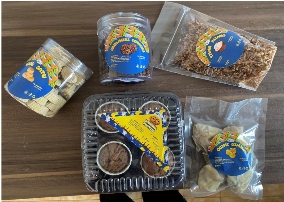
Gambar 5. Hasil Produk Olahan Berbahan Baku Ikan dan Pisang