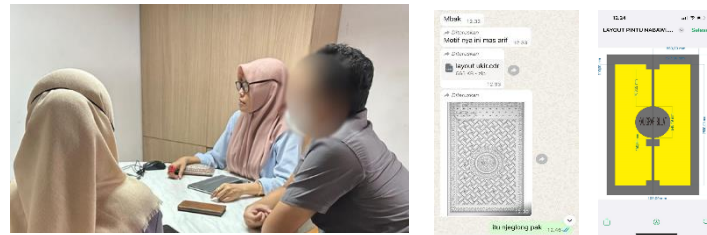
Gambar 5. Proses kegiatan pendampingan

karena program pendampingan ini memberikan solusi nyata atas masalah pintu lama yang kurang estetis dan cepat rusak, dengan anggaran yang masuk dalam kriteria kewajaran. Mereka menilai bahwa rancangan baru tidak hanya meningkatkan kualitas material dan kekuatan pintu, tetapi juga memberi nilai estetika religius yang menambah kekhikmatan suasana beribadah. Dengan demikian, kegiatan pendampingan ini tidak hanya berhasil meningkatkan kualitas fisik pintu masjid, tetapi juga memberikan kontribusi transfer ilmu yang nyata dalam kehidupan bermasyarakat. Evaluasi keberhasilan program pendampingan jangka panjang berupa pemasangan dan monitoring waktu penggunaan menjadi program keberlanjutan kegiatan ini di masa yang akan datang. Adapun perbandingan sebelum dan setelah adanya pendampingan bisa dilihat pada tabel 3.