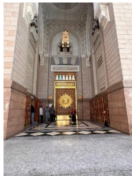
Gambar 1. Pintu Masjid Nabawi

Metode desain adaptif diartikan sebagai modifikasi dan adaptasi aspek desain yang terinspirasi dari Masjid Nabawi sesuai dengan kondisi lokal. Kondisi lokal yang akan diterapkan meliputi anggaran biaya, pemilihan produsen dan material lokal, serta kondisi lingkungan dan iklim setempat. Adanya kegiatan pendampingan ini dapat membantu mitra memahami prinsip-prinsip dalam merancang pintu masjid yang mengutamakan fungsi serta mempertimbangkan estetika bentuk serta sesuai dengan kebutuhan jamaah di sekitar Masjid Al-Furqon. Selain itu, tidak hanya mencerminkan arsitektur inspiratif Masjid Nabawi, tetapi juga kuat secara struktural, mudah dalam pemeliharaan, aman, serta memenuhi standar aksesibilitas bagi jamaah lansia dan penyandang disabilitas.