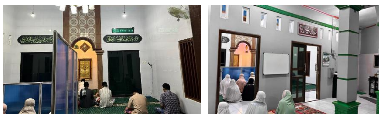
Gambar 4. Kondisi awal pintu dan Masjid

Sebelum pendampingan, pintu utama Masjid Al Furqon menggunakan pintu kayu sederhana dengan engsel standar, mudah lapuk karena kelembaban, serta tidak memiliki elemen estetis yang kuat (lihat gambar 4). Setelah implementasi desain baru, pintu masjid diharapkan akan tampil lebih megah, kokoh, dan representatif, sekaligus meningkatkan daya tarik visual serta kenyamanan jamaah.