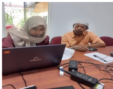
Gambar 4. Pendampingan Pembuatan NPWP Melalui Coretax Di KPP Pratama Pati

Pendampingan pembuatan nomor pokok wajib pajak (NPWP) bagi masyarakat melalui coretax merupakan kegiatan yang berorientasi pada pemberdayaan masyarakat dalam mengakses layanan administrasi perpajakan secara mandiri. Dalam pelaksanaan pendampingan terdapat 12 relawan pajak yang ditempatkan di KPP Pratama Pati, dengan pembagian tugas secara bergiliran yaitu enam orang bertugas membantu pelaporan SPT pada pagi hari dan enam orang lainnya membantu proses pembuatan NPWP. Pada siang hari, mereka bergantian peran agar pelayanan tetap optimal sepanjang hari. Pembuatan NPWP saat ini dilakukan secara daring melalui sistem Coretax dengan menggunakan nomor induk kependudukan (NIK). Dalam pelaksanaannya, masyarakat yang ingin membuat NPWP wajib menyiapkan dokumen berupa KTP dan Kartu Keluarga (KK). Khusus bagi istri yang ingin membuat NPWP atas namanya sendiri, suaminya harus sudah memiliki NPWP terlebih dahulu, karena sistem akan mengaitkan status perpajakan istri dengan suami. Dalam hal ini relawan pajak berperan memberikan pendampingan secara langsung dalam proses pembuatannya, sebagai upaya pemberdayaan wajib pajak agar memahami prosedur pendaftaran secara menyeluruh.