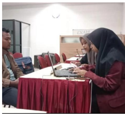
Gambar 2. Pendampingan Pelaporan SPT Tahunan Di KPP Pratama Pati

Pendampingan pelaporan SPT Tahunan Orang Pribadi 1770S dan 1770SS melalui web DJP (E-Filing). Dalam hal ini, relawan pajak berperan untuk memberikan arahan, bantuan, serta pendampingan kepada wajib pajak dalam mengisi dan melaporkan SPT Tahunan. Sebelum proses pelaporan dimulai, wajib pajak diharapkan untuk menyiapkan dokumen-dokumen pendukung seperti bukti potong (Formulir 1721-A1 atau 1721-A2). Kegiatan ini dilakukan dengan membimbing langsung wajib pajak melakukan pelaporan SPT sendiri melalui Hp ataupun laptop yang telah disediakan oleh KPP Pratama Pati dengan didampingi relawan pajak untuk mengidentifikasi kebutuhan serta memberikan solusi apabila terjadi permasalahan teknis. Melalui kegiatan ini, relawan pajak tidak hanya membantu penyelesaian pelaporan, tetapi juga mendorong pemberdayaan wajib pajak agar terbiasa melakukan pelaporan SPT Tahunan secara mandiri di masa mendatang. (Wijaya et al., 2022)