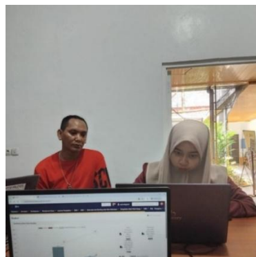
Gambar 6. Pendampingan Aktivasi Coretax

Kegiatan pendampingan aktivasi Coretax diutamakan kepada wajib pajak yang telah memiliki akun DJP Online serta telah melakukan pemadanan Nomor Pokok Wajib Pajak (NPWP) dengan Nomor Induk Kependudukan (NIK) yang telah diatur dalam kebijakan terbaru Direktorat Jenderal Pajak (DJP). Hal ini bertujuan untuk meminimalisasi kendala teknis dan administratif selama proses aktivasi. Tahapan aktivasi akun Coretax dimulai dengan mengakses laman resmi Coretax. Wajib pajak memilih menu aktivasi akun, kemudian mencentang pernyataan bahwa telah terdaftar sebagai wajib pajak. Selanjutnya, dilakukan pengisian data identitas seperti jenis Wajib Pajak, detail kontak, serta proses verifikasi melalui pengambilan foto dan konfirmasi pernyataan persetujuan. Setelah semua tahapan selesai, wajib pajak diminta untuk membuka email konfirmasi yang dikirimkan oleh DJP dan melakukan login pertama pada sistem Coretax. Selain itu, terdapat tahapan yang lebih mudah yaitu cukup memilih menu lupa sandi pada laman Coretax, kemudian mengisi NIK dan captcha, mencentang persetujuan, dan mengklik tombol kirim. Tahapan ini lebih efektif dalam mempercepat proses aktivasi karena