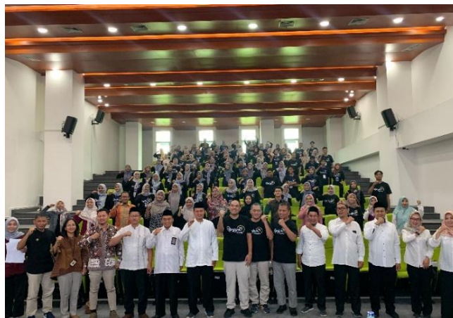
Gambar 1. Pembekalan Relawan Pajak Di UIN Sunan Kudus

Tahap awal dimulai dengan perekrutan anggota yang diselenggarakan DPJ dan tax center UIN Sunan Kudus sebagai pihak yang mengkoordinasi berjalannya kegiatan relawan pajak. Mahasiswa yang berminat mengikuti program ini diarahkan untuk melakukan pendaftaran melalui laman resmi Renjani dan mengikuti tahapan seleksi berupa wawancara. Lalu memahami materi perpajakan yang ada di laman resmi renjani, kemudian mengerjakan soal dari materi tersebut diantaranya materi BDS relawan, pelatihan pajak relawan, soft skill relawan pajak, dan kehumasan relawan pajak. Setelah itu mengupload COC (code of conduct) di website renjani dan mengumpulkan bukti fisiknya ke tax center UIN Sunan Kudus. Selanjutnya relawan pajak dikukuhkan dan diberikan pembekalan secara luring oleh DJP dan Tax Center UIN Sunan Kudus berupa pelatihan teknis pelaporan SPT Tahunan, aktivasi Coretax, serta pembuatan NPWP.