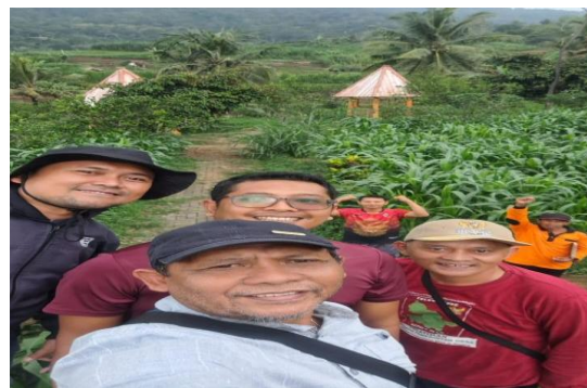
Gambar 7. Tim di lokasi eduwisata yang telah dikembangkan

Dari sisi dampak ekonomi, diversifikasi tanaman buah memberikan potensi multiple income streams bagi petani. Agrowisata telah terbukti sebagai alat yang kuat untuk pengembangan pedesaan berkelanjutan dengan potensi diversifikasi ekonomi, pelestarian warisan budaya, dan kesadaran lingkungan (Krittayaruangroj et al., 2023). Studi tentang pengembangan agrowisata berbasis masyarakat di desa-desa Jawa Timur juga menunjukkan bahwa sinergi antara pemerintah lokal, kelompok tani, dan komunitas wisata merupakan faktor kunci keberhasilan program (Trisnanto et al., 2023).