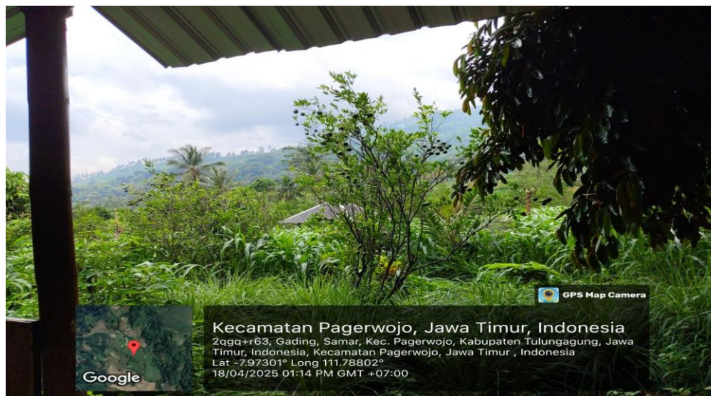
Gambar 1. Survei lapangan lokasi eduwisata Desa Samar

risikonya. Temuan kedua adalah kondisi infrastruktur air yang memprihatinkan: terdapat 3 bak penampungan air hujan yang bocor dan tidak dapat difungsikan secara optimal. Temuan ketiga adalah belum adanya penanda dan penataan spot tanaman yang jelas untuk keperluan eduwisata, meskipun beberapa pengunjung sudah mulai berdatangan secara informal.