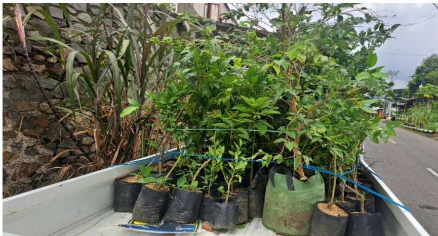
Gambar 5. Bibit tanaman buah siap ditanam