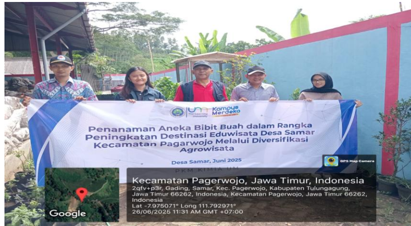
Gambar 6. Tim pengabdian bersama masyarakat Desa Samar