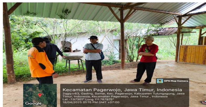
Gambar 2. Koordinasi kegiatan dengan mitra dan pemerintah desa

Kegiatan sosialisasi dilaksanakan pada tanggal 15 Maret 2025 di Balai Desa Samar dan dihadiri oleh 28 petani mitra serta 7 perangkat desa. Koordinasi kegiatan dengan mitra dan pemerintah desa berlangsung secara intensif untuk memastikan program sesuai kebutuhan masyarakat (Gambar 2).