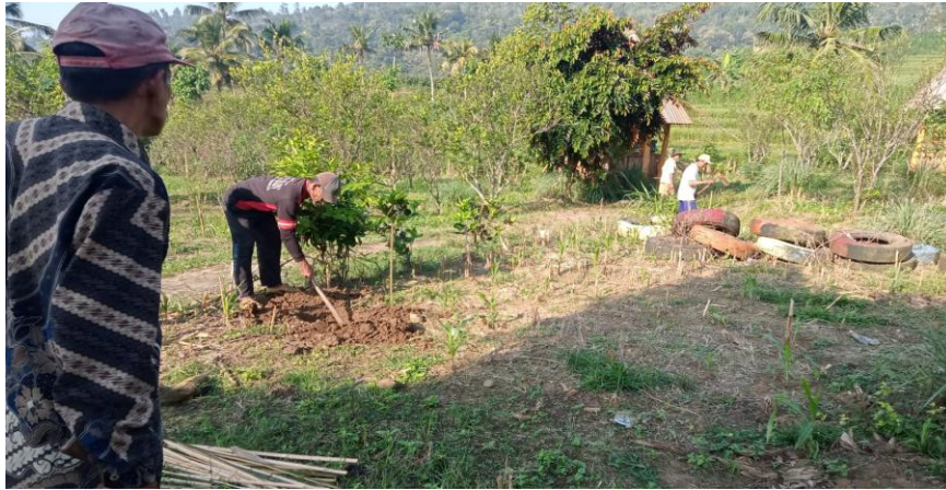
Gambar 4. Proses penanaman bibit tanaman buah