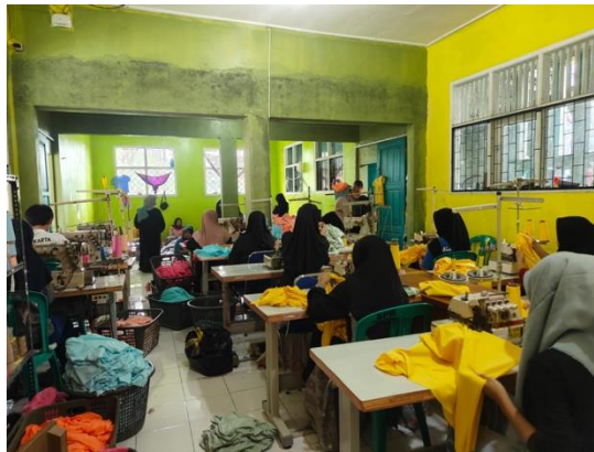
Gambar 1. Unit usaha konveksi di SLB Yakalimu

Yayasan SLB YAKALIMU di Kecamatan Wanayasa, Kabupaten Purwakarta, Jawa Barat, merupakan institusi pendidikan luar biasa dengan 82 peserta didik (54 laki-laki dan 28 perempuan) dari jenjang PAUD hingga SMA, dengan keragaman kebutuhan khusus (A, B, C/C1, D/D1, E, P, dan Q) serta akreditasi A. SLB ini telah mengembangkan program vokasional yang berdampak, salah satunya unit konveksi tata busana yang menghasilkan produk dan kerja sama dengan beberapa perusahaan. Capaian tersebut menunjukkan kesiapan kelembagaan dalam membangun ekosistem pembelajaran vokasi yang produktif.