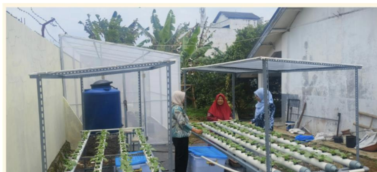
Gambar 4. Kegiatan Monitoring Pemeliharaan Tanaman dan Instalasi

Dari perspektif penguatan nilai tambah, pelatihan pengemasan memperkenalkan keterampilan hilir yang sebelumnya belum tersedia di mitra (Syaifuddin dan Rusdian, 2025). Secara konseptual, pengemasan sederhana dapat meningkatkan keberterimaan produk dan menjadi pintu masuk aktivitas produktif sekolah. Dampak ekonomi langsung (misalnya volume penjualan, margin, atau kanal pemasaran) belum dapat diukur secara kuantitatif pada tahap ini, namun dapat dipertimbangkan sebagai indikasi potensi dan arah tindak lanjut program.