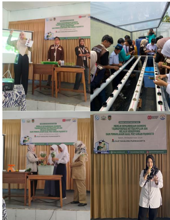
Gambar 2. Pelatihan Budidaya Hidroponik, Pengemasan, Seminar Parenting

dan Asriyanti, 2013). Dalam konteks pendidikan vokasional ABK, model pembelajaran yang menekankan praktik langsung dan pengalaman kerja sederhana penting untuk memperkuat kesiapan transisi ke aktivitas produktif (Wahyuni, 2018).