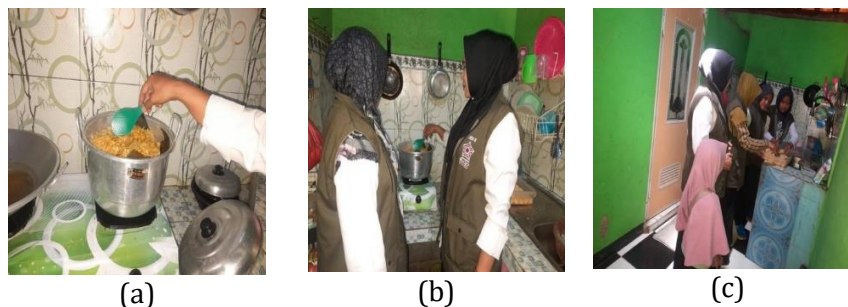
Gambar 6. Proses (a) pengolahan ubi cilembu, (b) pengolahan singkong, dan (c) pendampingan pengolahan bahan pangan lokal di rumah warga

Setelah peserta mengikuti pelatihan dan praktik langsung pengolahan ubi cilembu dan singkong menjadi Pemberian Makanan Tambahan (PMT) bergizi, kegiatan PkM dilanjutkan dengan pendampingan agar peserta mempraktikkan kembali keterampilan tersebut di rumah masing-masing. Pendekatan ini memungkinkan tim menilai perubahan praktik nyata di keluarga, termasuk peningkatan variasi menu, teknik pengolahan yang mempertahankan nilai gizi, serta keterlibatan anggota keluarga dalam penyediaan PMT berbasis pangan lokal. Observasi dan laporan peserta menunjukkan adanya peningkatan kepatuhan terhadap praktik gizi seimbang, terutama bagi ibu hamil dan balita, yang sebelumnya menghadapi hambatan dalam pemanfaatan pangan lokal. Temuan ini menegaskan bahwa keberlanjutan praktik berbasis rumah tangga penting untuk memperkuat dampak sosial pelatihan, meningkatkan kualitas konsumsi gizi keluarga, serta mendukung upaya pencegahan stunting berbasis keluarga di Desa Kecepak, Kabupaten Batang.