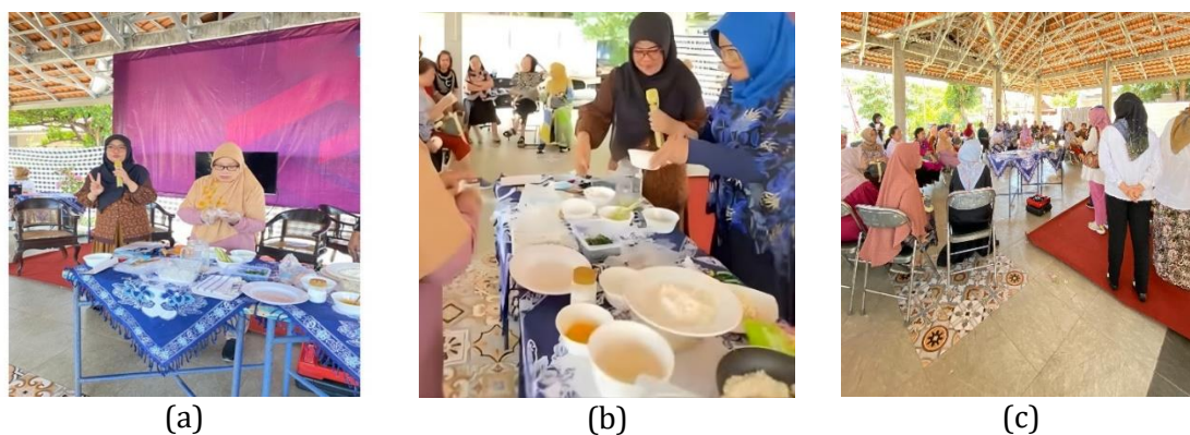
Gambar 5. Kegiatan (a) pelatihan ubi cilembu, (b) pelatihan singkong, dan (c) demonstrasi pengolahan ubi cilembu dan singkong

Demonstrasi praktik pengolahan pangan lokal dilakukan secara interaktif, di mana peserta bersama tim PkM membuat puree ubi, kroket singkong, nugget singkong keju, dan ongol-ongol sebagai camilan sehat. Selama kegiatan, peserta aktif bertanya mengenai teknik agar tekstur sesuai kebutuhan balita, cara penyimpanan, dan modifikasi rasa, menunjukkan peningkatan keterampilan praktis yang dapat langsung diterapkan di rumah. Analisis hasil kegiatan menunjukkan bahwa pelatihan ini tidak hanya memperluas pengetahuan, tetapi juga meningkatkan kemampuan peserta dalam mengolah pangan lokal secara kreatif, menjawab masalah kurangnya inovasi pangan di tingkat keluarga yang sering berkontribusi pada stunting (Marchamah et al., 2024). Temuan ini sejalan dengan Lestari et al. (2022) yang menyebutkan bahwa keterampilan praktis ibu atau kader sangat penting agar makanan lokal lebih menarik dan diterima oleh anak. Dengan demikian, pelatihan ini berpotensi mendorong penerapan praktik pemberian PMT bergizi di rumah tangga dan mendukung keberlanjutan inovasi pangan lokal dalam pencegahan stunting berbasis keluarga.