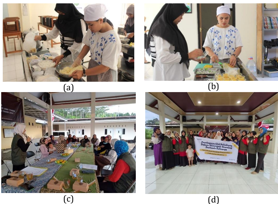
Gambar 3. Kegiatan (a) sosialisasi kader, (b) edukasi kader, (c) pemaparan program, dan (d) foto bersama kader Desa Kecepak, Kabupaten Batang

Kegiatan penyuluhan berlangsung secara interaktif, di mana kader Desa Kecepak berbagi pengalaman terkait tantangan keluarga dalam memberikan makanan bergizi, seperti keterbatasan ekonomi, preferensi makanan anak, dan dominasi makanan instan. Temuan ini sejalan dengan laporan Marchamah (2024) yang menyebutkan rendahnya inovasi dalam pengolahan pangan lokal dan minimnya pengetahuan keluarga sebagai faktor berkelanjutan stunting, meskipun berada di daerah penghasil pangan. Diskusi interaktif selama penyuluhan memungkinkan tim PkM mengidentifikasi hambatan nyata yang dihadapi kader dalam mendampingi keluarga, sekaligus menjadi dasar perancangan strategi pemberdayaan yang lebih efektif dan sesuai konteks lokal.