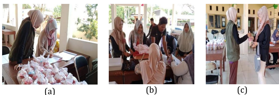
Gambar 7. Pemberian hasil inovasi (a) olahan ubi cilembu, (b) olahan singkong, (c) distribusi bahan pangan lokal untuk pembuatan PMT Posyandu

Temuan ini sejalan dengan Hara et al. (2024), yang menekankan bahwa pendampingan intensif mampu meningkatkan pengetahuan dan praktik gizi keluarga, serta keberadaan dapur hidup sebagai sumber pangan tambahan. Selain itu, pendampingan memperkuat peran kader sebagai agen perubahan gizi di desa, sesuai dengan temuan (Watini et al., 2023), serta mendukung pengembangan potensi lokal yang berkelanjutan melalui konsep bioekonomi (Nuha & Utami, 2020). Hasil ini menunjukkan bahwa kombinasi pelatihan, praktik langsung, dan pendampingan rumah tangga efektif dalam meningkatkan kapasitas keluarga serta keberlanjutan inovasi pangan lokal untuk pencegahan stunting berbasis keluarga.