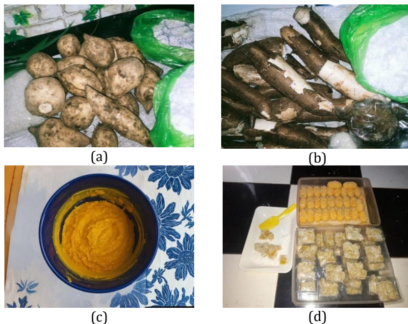
Gambar 4. Bahan (a) ubi cilembu, (b) singkong, (c) adonan, dan (d) olahan jadi (nugget dan ongol-ongol)

tetapi juga berpotensi meningkatkan implementasi praktik pemberian PMT bergizi di rumah tangga, sehingga mendukung keberlanjutan inovasi pangan lokal dan pencegahan stunting berbasis keluarga.