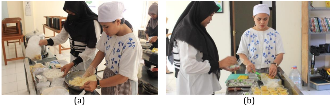
Gambar 2. Pembuatan (a) inovasi resep dan (b) modifikasi oleh mahasiswa di Laboratorium Kesehatan

Selain itu, tim melakukan persiapan materi teknis berupa modifikasi resep pangan lokal berbahan dasar ubi cilembu dan singkong, yang dilakukan bersama mahasiswa sebagai bagian dari kegiatan berbasis proyek. Proses kolaboratif ini menghasilkan variasi menu PMT yang lebih inovatif, bernilai gizi tinggi, dan praktis diterapkan oleh keluarga, sekaligus memperkuat integrasi antara pembelajaran akademik dan implementasi pengabdian masyarakat. Evaluasi awal menunjukkan bahwa keterlibatan mahasiswa dan kader dalam perancangan materi meningkatkan pemahaman peserta terhadap pemanfaatan pangan lokal, meskipun data kuantitatif mengenai perubahan praktik pemberian PMT dan variasi menu keluarga masih terbatas. Dengan demikian, persiapan yang matang dan kolaboratif ini mendukung pelaksanaan PkM secara terarah, relevan, dan responsif terhadap kebutuhan gizi keluarga di Desa Kecepak.