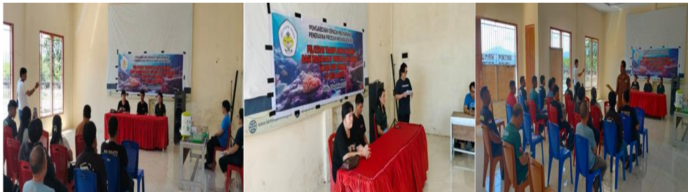
Gambar 1. Diskusi interaktif dengan peserta pelatihan di aula Desa Bahoi

Pada aspek keterampilan, observasi selama praktik lapangan memperlihatkan bahwa peserta mampu mengikuti tahapan dasar transplantasi, seperti penyiapan media, penempelan fragmen, dan penempatan rangka di lokasi yang telah ditentukan, meskipun masih diperlukan latihan lanjutan untuk menyempurnakan teknik dan konsistensi penerapan SOP. Pola ini sejalan dengan pendekatan community-based conservation yang menekankan transfer pengetahuan praktis melalui pembelajaran langsung (learning by doing) dan kerja sama tim sebagai strategi memperkuat kapasitas lokal.