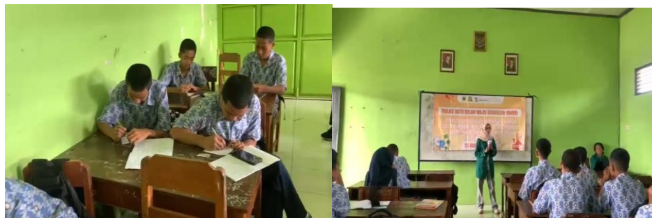
Gambar 3. Kegiatan Sosialisasi dan Penilaian Pemahaman Siswa

integritas merupakan proses bertahap yang memerlukan penguatan berkelanjutan melalui pembiasaan dan dukungan lingkungan sekolah.