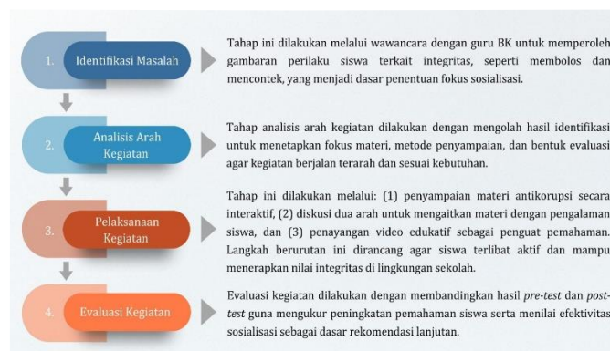
Gambar 2. Tahapan Kegiatan Pengabdian

Proses kegiatan sosialisasi pendidikan antikorupsi diawali dengan tahap perencanaan yang tersusun dalam empat langkah utama, yaitu identifikasi masalah, analisis arah kegiatan, pelaksanaan kegiatan, dan evaluasi kegiatan. Tahap identifikasi masalah dilakukan melalui wawancara dengan guru Bimbingan Konseling (BK) untuk memperoleh gambaran awal mengenai perilaku siswa yang berkaitan dengan kejujuran dan kedisiplinan. Selanjutnya, tahap analisis arah kegiatan difokuskan pada penentuan prioritas materi, pemilihan metode sosialisasi, serta perancangan instrumen evaluasi kegiatan. Tahap pelaksanaan kegiatan meliputi penyampaian materi, diskusi dua arah, dan penayangan video edukatif. Sedangkan pada tahap evaluasi dilakukan secara deskriptif melalui perbandingan hasil pre-test dan post-test sebagai alat evaluasi kegiatan pengabdian masyarakat untuk melihat perubahan pemahaman siswa terhadap nilai integritas dan perilaku antikorupsi. Tahapan ini untuk memastikan kegiatan dapat berlangsung secara terarah, sistematis, dan relevan. Alur tahapannya dapat tergambar pada ilustrasi di bawah ini: