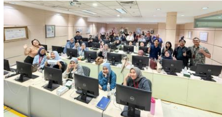
Gambar 4. Foto Bersama

mendukung efisiensi administrasi. Secara kuantitatif, selisih nilai pre-test dan post-test menunjukkan bahwa pelatihan berbasis praktik memberikan dampak positif terhadap peningkatan literasi digital tenaga kependidikan, meskipun dilaksanakan dalam durasi yang relatif singkat yaitu satu hari. Hasil evaluasi menunjukkan bahwa pendekatan pelatihan yang memadukan penyampaian materi dan praktik langsung mampu membantu peserta memahami penggunaan aplikasi secara lebih kontekstual. Peningkatan pemahaman tersebut juga mengindikasikan adanya kesiapan awal peserta untuk mengadopsi pola kerja berbasis kolaborasi digital dalam aktivitas administrasi.