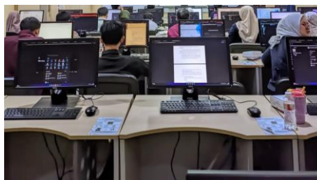
Gambar 1. Pelatihan Ms. Office 365

Dokumentasi suasana kegiatan pelatihan ditunjukkan pada Gambar 1, yang memperlihatkan keterlibatan peserta dalam mengikuti materi dan diskusi selama kegiatan berlangsung. Tingginya partisipasi peserta selama proses pembelajaran menunjukkan bahwa pendekatan pelatihan berbasis praktik mampu menciptakan suasana belajar yang interaktif dan relevan dengan kebutuhan kerja tenaga kependidikan. Pendekatan ini mendorong peserta untuk tidak hanya memahami konsep, tetapi juga langsung mengaitkan materi pelatihan dengan permasalahan administratif yang mereka hadapi.