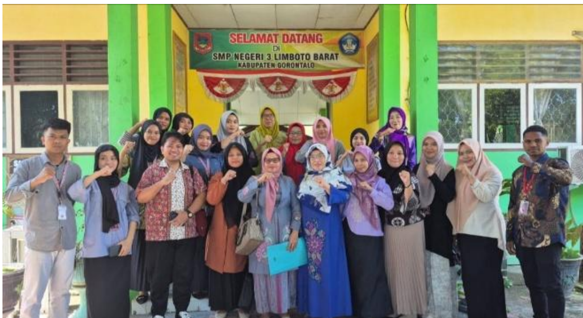
Gambar 2. Observasi Awal

Kegiatan pengabdian kepada masyarakat yang dilaksanakan melalui pelatihan manajemen kelas efektif berbasis Participatory Action Research (PAR) pada guru SMP Negeri 01 dan SMA Negeri 01 Limboto Barat menunjukkan hasil yang signifikan dalam meningkatkan kapasitas profesional guru. Hasil kegiatan ini diperoleh dari serangkaian tahapan PAR yang meliputi identifikasi masalah, perencanaan tindakan, pelaksanaan pelatihan, pendampingan implementasi, serta refleksi dan evaluasi bersama guru mitra. Seluruh proses tersebut memberikan gambaran yang komprehensif mengenai perubahan yang terjadi baik pada level individu guru maupun pada dinamika kelas secara keseluruhan.