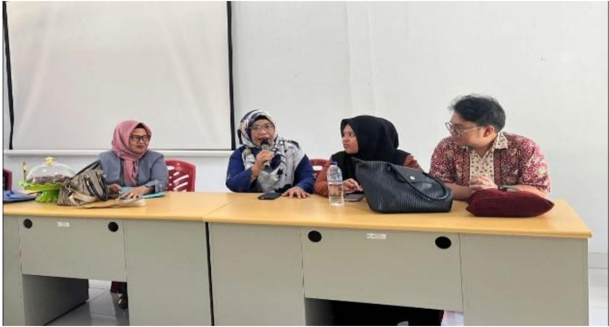
Gambar 3. Diskusi Penyusunan Program Pelatihan ( Workshop )

Pada tahap perencanaan, tim pengabdian bersama guru berhasil menyusun program pelatihan yang berbasis kebutuhan nyata di lapangan. Materi pelatihan difokuskan pada penguatan konsep manajemen kelas efektif, strategi peningkatan partisipasi siswa, serta teknik pengelolaan waktu dan interaksi pembelajaran. Selain itu, disusun pula perangkat pendukung seperti modul pelatihan, skenario pembelajaran, serta instrumen evaluasi berupa lembar observasi dan soal post-test. Perencanaan ini menghasilkan kerangka kegiatan yang lebih terarah dan sesuai dengan permasalahan yang dihadapi oleh guru.