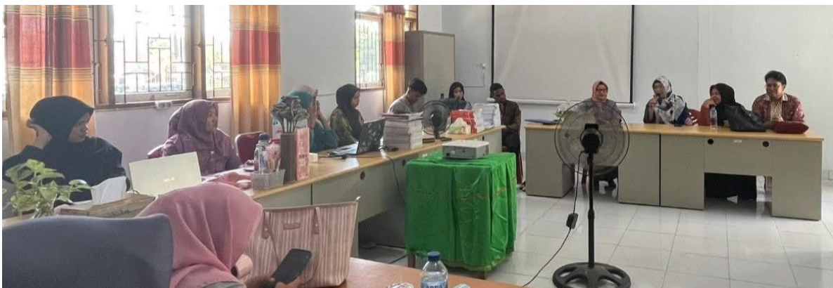
Gambar 4. Pelaksanaan Pelatihan ( Workshop )

Pada tahap perencanaan, tim pengabdian bersama guru berhasil menyusun program pelatihan yang berbasis kebutuhan nyata di lapangan. Materi pelatihan difokuskan pada penguatan konsep manajemen kelas efektif, strategi peningkatan partisipasi siswa, serta teknik pengelolaan waktu dan interaksi pembelajaran. Selain itu, disusun pula perangkat pendukung seperti modul pelatihan, skenario pembelajaran, serta instrumen evaluasi berupa lembar observasi dan soal post-test. Perencanaan ini menghasilkan kerangka kegiatan yang lebih terarah dan sesuai dengan permasalahan yang dihadapi oleh guru.