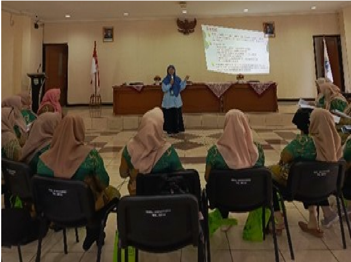
Gambar 2. Kegiatan saat edukasi tentang Tanda-tanda Bahaya kehamilan