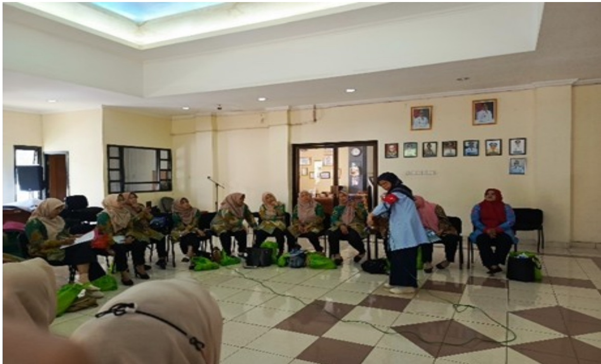
Gambar 3. Kegiatan edukasi Pengukuran tekanan darah