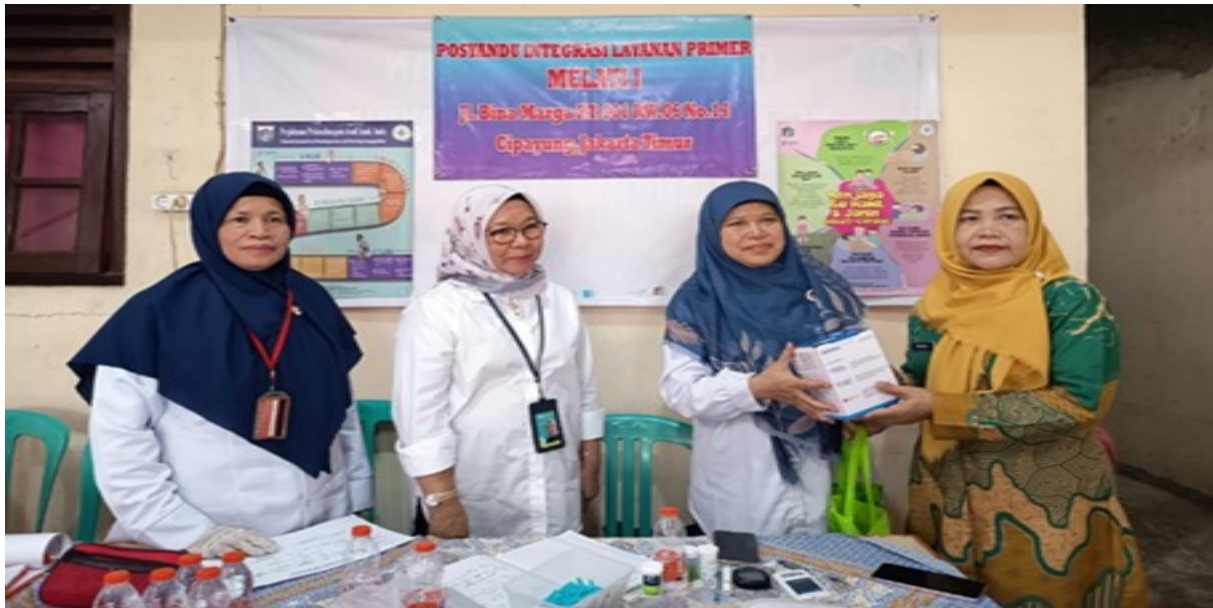
Gambar 4. Penyerahan Alat pengukur tekanan darah kepada ketua Posyandu