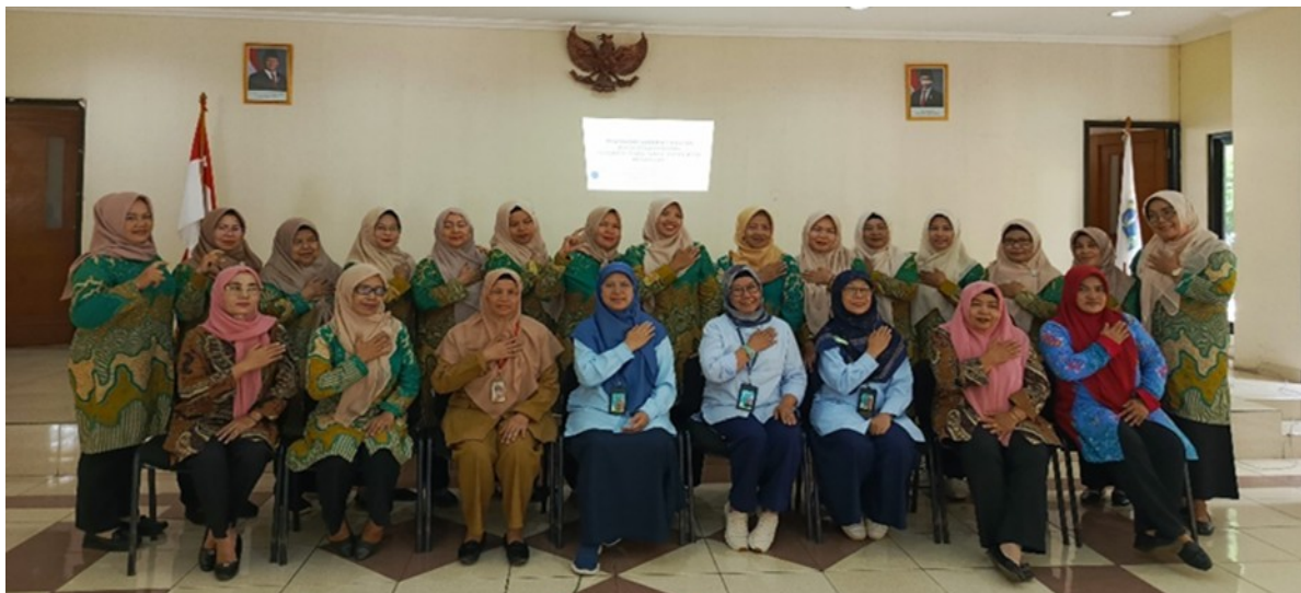
Gambar 5. Foto Bersama Kader Kesehatan, ketua PKK dan penanggung jawab dari Puskesmas kelurahan Cipayung