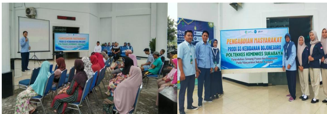
Gambar 3. Foto kegiatan peserta Pengabmas