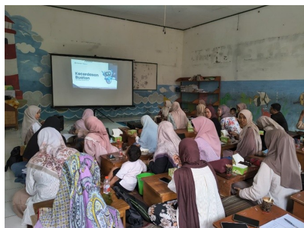
Gambar 4. Pelatihan literasi digital dan anti bullying

Kegiatan pelatihan literasi digital dan penguatan karakter, khususnya terkait dengan pencegahan perilaku perundungan (anti bullying), juga memberikan dampak yang cukup positif. Berdasarkan hasil observasi selama kegiatan berlangsung, terlihat adanya perubahan dalam pola interaksi siswa, seperti meningkatnya sikap saling menghargai, penggunaan bahasa yang lebih sopan, serta berkurangnya perilaku yang berpotensi mengarah pada bullying. Meskipun