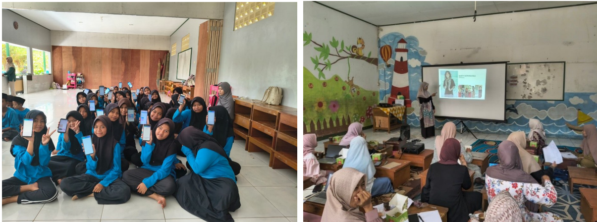
Gambar 1. Pelatihan canva bagi siswa kelas 6 dan guru

Kegiatan diawali dengan pelatihan penggunaan aplikasi canva yang menjadi salah satu titik awal perubahan, khususnya bagi siswa dan guru yang sebelumnya masih memiliki keterbatasan dalam pemanfaatan media digital. Pada tahap awal pelaksanaan, sebagian guru masih menunjukkan keraguan dalam mengoperasikan fitur-fitur dasar canva serta belum familiar dengan konsep desain digital. Kondisi ini menunjukkan adanya kesenjangan keterampilan digital yang cukup mendasar. Namun, melalui proses pendampingan yang dilakukan secara bertahap dan berkelanjutan, guru mulai menunjukkan peningkatan kemampuan yang signifikan. Guru tidak hanya mampu memahami penggunaan fitur dasar, tetapi juga mulai dapat mengembangkan desain sederhana secara mandiri sebagai media pembelajaran yang lebih menarik dan interaktif.