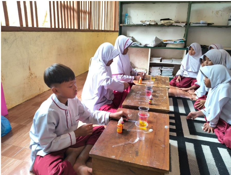
Gambar 3. Peraktek mencampur warna dasar

pelatihan tidak hanya berdampak pada peningkatan keterampilan teknis, tetapi juga pada kemampuan berpikir kreatif dan komunikatif siswa dalam menyampaikan ide secara visual.