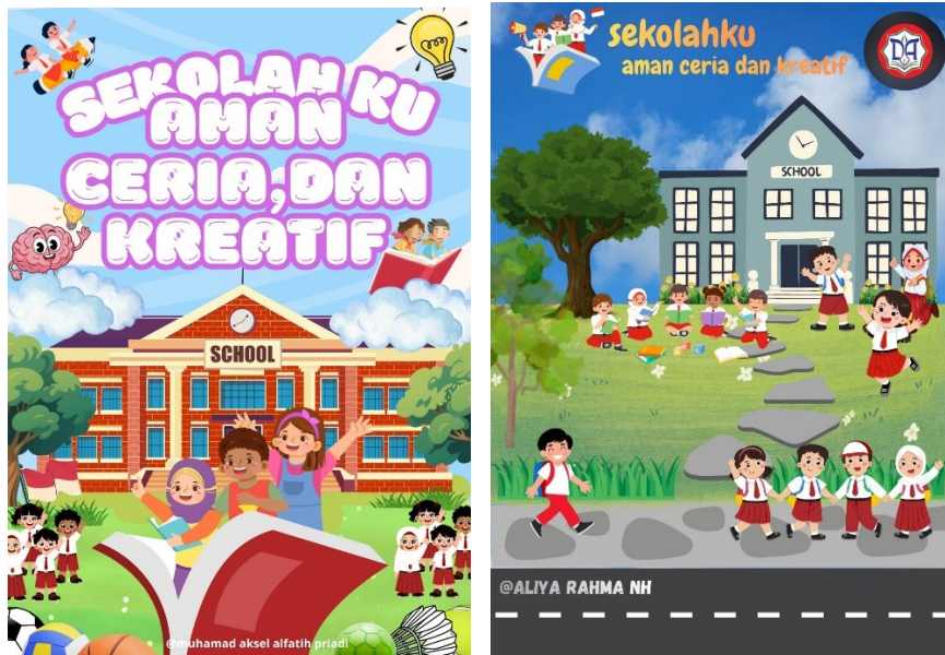
Gambar 2. Contoh hasil lomba poster digital menggunakan canva

Secara keseluruhan, hasil kegiatan menunjukkan bahwa pelatihan canva memberikan kontribusi yang cukup signifikan dalam meningkatkan kompetensi digital guru. Guru tidak hanya memperoleh keterampilan baru, tetapi juga mengalami perubahan pola pikir dalam memanfaatkan teknologi sebagai bagian integral dari proses pembelajaran.