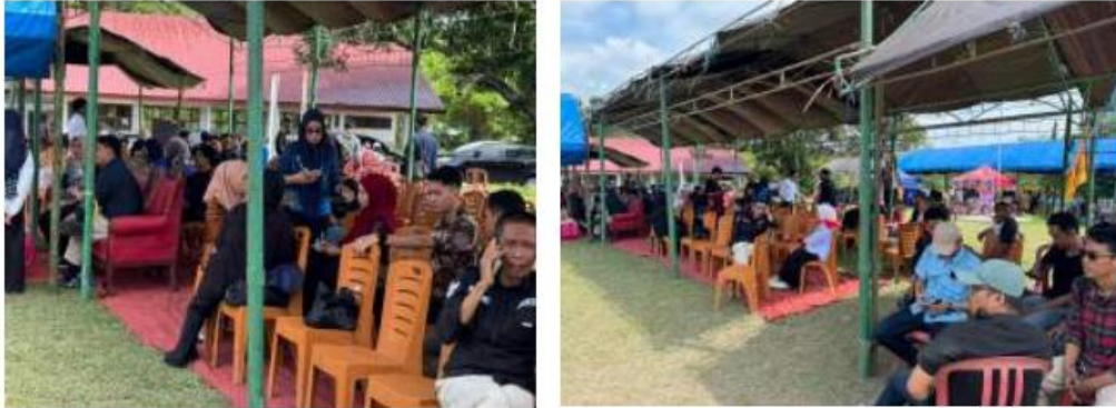
Gambar 1. Pelaksanaan Kegiatan

pemuda. Upaya ini bertujuan menciptakan ekosistem wirausaha yang saling terhubung, di mana pemuda dapat bertukar pengalaman, mendapatkan dukungan, dan membangun jejaring usaha bersama. Selain itu, program ini juga memfasilitasi akses permodalan, baik melalui koperasi pemuda, lembaga keuangan mikro, maupun kolaborasi dengan pemerintah daerah dan sektor swasta. Akses modal yang memadai memungkinkan pemuda untuk mengembangkan bisnis rintisan dan meningkatkan skala produksi.