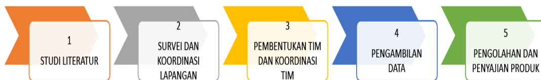
Gambar 2 Diagram Alir Metodologi Kegiatan

Secara umum kegiatan pengabdian yang dilakukan terdiri dari beberapa tahapan. Tahapan itu antara lain studi literatur, survei lapangan, pembentukan dan koordinasi dengan tim akuisisi data dan survei lapangan, pengumpulan data yang dibutuhkan, pengolahan data, dan penyajian data yang ditunjukkan oleh Gambar 2.