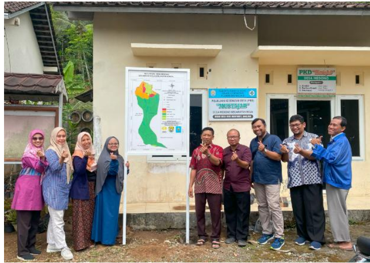
Gambar 5 Kegiatan Pengabdian Penyerahan Hasil Peta Profil Desa Medono Kepada Pihak Mitra (Pemangku Desa Medono)

irigasi) berdasarkan aksesibilitas; (b) merencanakan lokasi BUMDes yang strategis dekat pusat permukiman; (c) mensosialisasikan batas wilayah kepada warga untuk mengurangi sengketa lahan; (d) mengarahkan pengembangan kebun kopi di lereng dengan kemiringan sesuai (data kontur).