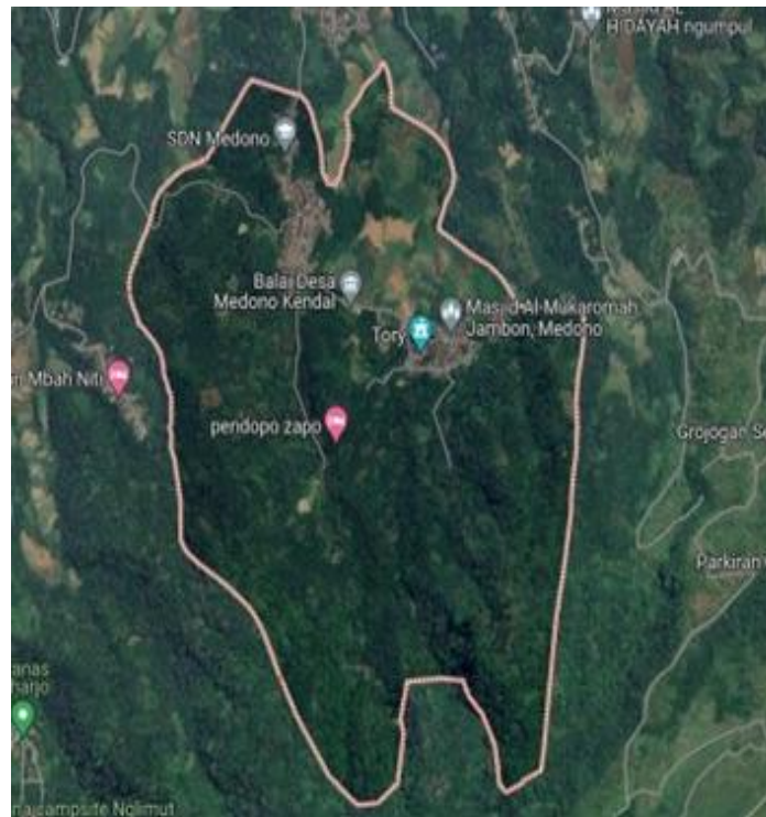
Gambar 1 Wilayah Desa Medono

seperti di Jawa Barat untuk pemetaan potensi agribisnis (Maskun et al., 2021) dan pengembangan komoditas unggulan berbasis data spasial (Oymatov et al., 2023).