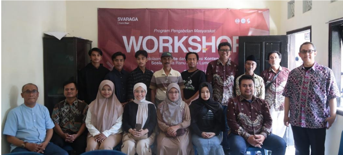
Gambar 1. Tim bersama warga setempat

Lokasi kegiatan berada di Desa Ranubedali, Kecamatan Ranuyoso, Kabupaten Lumajang. Desa ini dipilih karena memiliki potensi wisata alam, produk UMKM, dan sumber daya sosial yang cukup besar, namun pemanfaatan website dan media sosial desa sebagai sarana promosi dan komunikasi publik masih belum optimal. Kegiatan melibatkan berbagai unsur masyarakat, meliputi perangkat desa, pengelola website desa, kelompok sadar wisata (Pokdarwis), pelaku UMKM, karang taruna, serta tokoh masyarakat yang memiliki keterkaitan dengan pengembangan potensi desa.