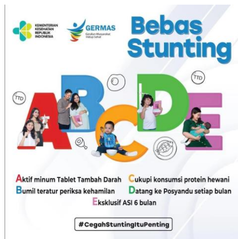
Gambar 4. Poster Bebas Stunting