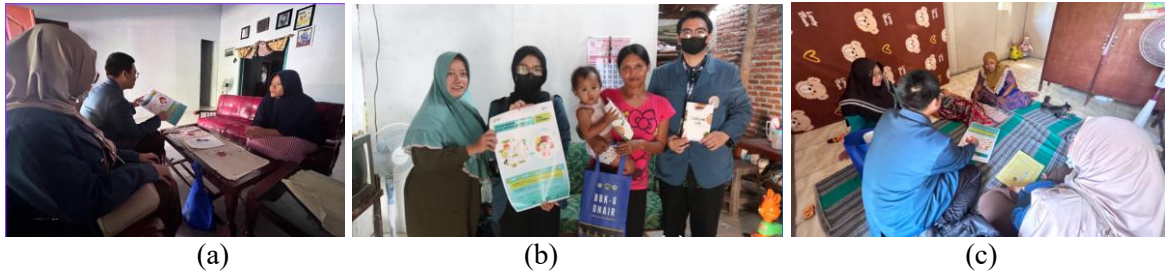
Gambar 6. Dokumentasi Edukasi Gizi dan wawancara