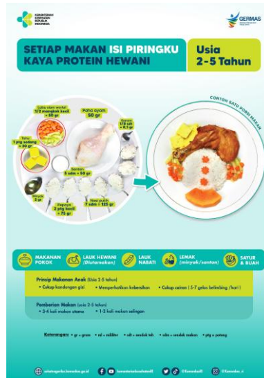
Gambar 3. Poster Isi Piringku usia 2-5 Tahun

peningkatan pemahaman, kegiatan ini juga memberikan nilai tambah berupa media edukasi seperti buku resep berbasis pangan lokal yang dapat digunakan secara berkelanjutan oleh masyarakat. Media ini diharapkan dapat membantu ibu dalam menyusun menu makanan bergizi dengan bahan yang mudah dijangkau, sehingga mendukung upaya pencegahan stunting secara praktis di tingkat rumah tangga.