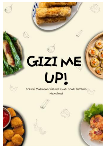
Gambar 5. Buku Saku Resep