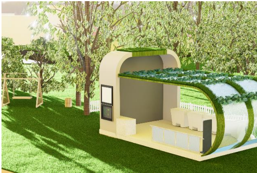
Gambar 3 Visualisasi 3D Bank Sampah di Kabupaten Lingga

Rangkaian kegiatan ini dirancang untuk secara langsung menjawab kesenjangan pemahaman teknis (terutama P4 dan P10) yang teridentifikasi saat Pre-Test, sekaligus memberikan luaran nyata berupa rancangan sistem dan visualisasi fisik. Model 3D ini berfungsi sebagai visualisasi nyata ( prototype ) dan acuan standar bagi DLH Kabupaten Lingga. Dengan adanya output ini, konsep abstrak mengenai alur kerja bank sampah terintegrasi kini memiliki bentuk fisik yang aplikatif, yang dapat digunakan oleh DLH sebagai dasar untuk perencanaan anggaran (RAB), studi kelayakan, dan acuan teknis pembangunan infrastruktur fisik Bank Sampah Induk di masa depan.