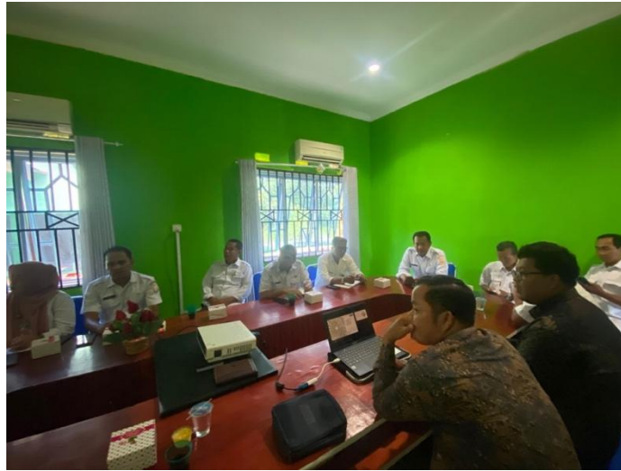
Gambar 2 Diskusi dan Pendampingan Intensif Tim Pengabdian dengan DLH Kabupaten Lingga

produktif guna mewujudkan kemandirian ekonomi masyarakat sekaligus menjaga kelestarian lingkungan secara berkelanjutan (Nurhayati et al., 2025; Rinwantin et al., 2025).