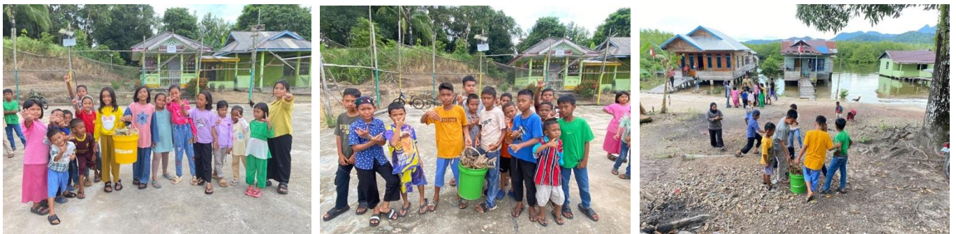
Gambar 5 Pemilahan Sampah bersama Anak Usia Dini di Daik, Lingga

Selain berfokus pada perancangan sistem dan pendampingan teknis bagi aparaturnya Dinas Lingkungan Hidup, kegiatan PKM ini juga mencakup aspek edukasi dan pemberdayaan masyarakat di level akar rumput untuk menjamin keberlanjutan model. Kegiatan ini diwujudkan dalam bentuk Sosialisasi Pemilahan Sampah bersama Anak Usia Dini di Daik Kabupaten Lingga, yang pelaksanaannya dibantu oleh tim mahasiswa pembantu lapangan. Kegiatan ini dirancang sebagai intervensi di sisi hulu (sumber sampah) dengan output strategis berupa penanaman pemahaman dan kebiasaan memilah sampah sejak usia dini. Pendekatan ini krusial karena keberhasilan Bank Sampah Unit (BSU) di level komunitas yang merupakan pondasi dari Model Bank Sampah Terintegrasi sangat bergantung pada ketersediaan sampah yang telah terpilah di sumbernya (rumah tangga). Dengan menyasar anak-anak sebagai agen perubahan melalui metode yang interaktif dan edukatif ( edutainment ), luaran langsung yang dicapai adalah peningkatan pengetahuan anak-anak dalam mengidentifikasi jenis sampah (organik, anorganik, dan B3). Luaran jangka panjang yang diharapkan adalah terbentuknya kebiasaan baru ini di dalam keluarga mereka, yang secara langsung akan berkontribusi pada efektivitas alur suplai sampah terpilah untuk Bank Sampah di Kabupaten Lingga di masa depan.