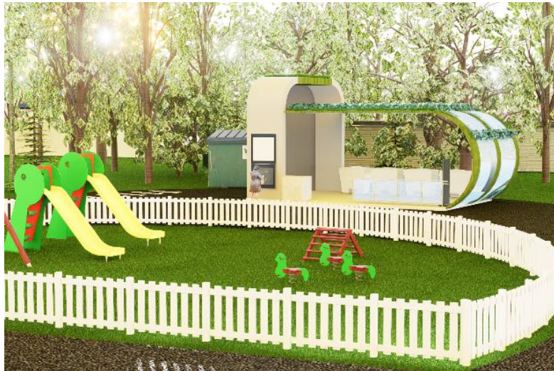
Gambar 4 3D Tampak Depan Pusat Administrasi dan Kelembagaan Bank Sampah Induk

Gambar ini adalah tampak depan yang menunjukkan wajah atau fasad utama dari fasilitas Bank Sampah Induk (BSI). Fungsinya adalah: