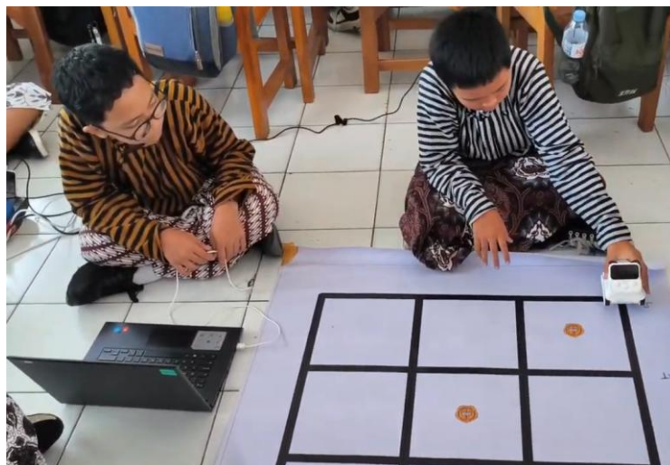
Gambar 2. Siswa melakukan praktik pemrograman dan pengujian pergerakan robot Codey Rocky.

Pada tahap lanjutan, siswa diberikan tantangan berbasis problem solving menggunakan media lapangan berbentuk grid. Dalam kegiatan ini, siswa diminta untuk menyusun algoritma agar robot dapat bergerak mengikuti jalur tertentu dan mencapai titik tujuan dengan mempertimbangkan urutan perintah, logika percabangan, dan pengulangan. Kegiatan ini terbukti mampu melatih kemampuan berpikir logis dan algoritmik siswa secara lebih mendalam (Çalışkan, 2020; Demir, 2021).