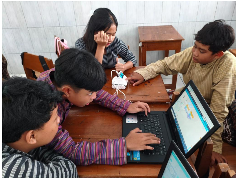
Gambar 1. Kegiatan pengenalan coding berbasis block menggunakan Codey Rocky pada siswa SMP Kanisius Wonosari.