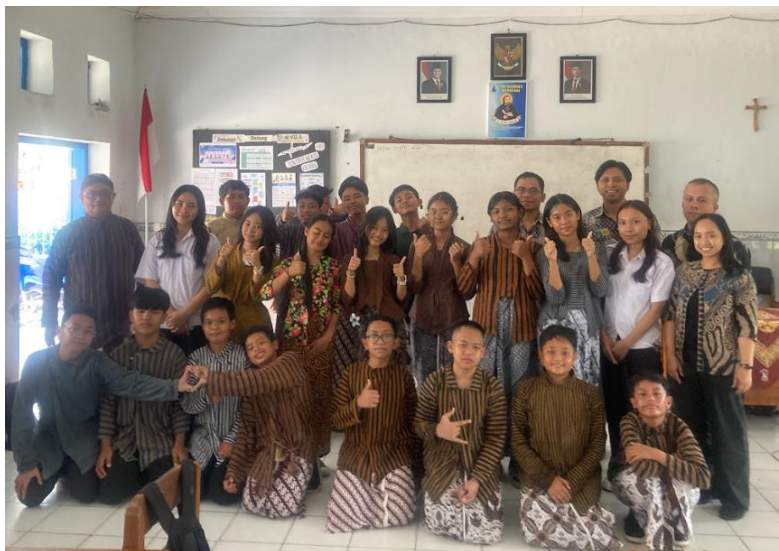
Gambar 4. Foto bersama tim pengabdian dan siswa SMP Kanisius Wonosari setelah pelaksanaan kegiatan pelatihan.

Secara keseluruhan, kegiatan ini menunjukkan bahwa pelatihan coding dan robotika berbasis Science, Technology, Engineering, Arts, and Mathematics mampu memberikan dampak positif terhadap peningkatan literasi teknologi siswa. Siswa tidak hanya memahami konsep dasar pemrograman, tetapi juga menunjukkan peningkatan minat terhadap bidang teknologi dan rekayasa. Kegiatan ini juga membuka wawasan siswa bahwa teknologi tidak hanya digunakan, tetapi juga dapat dirancang dan dikembangkan secara mandiri.