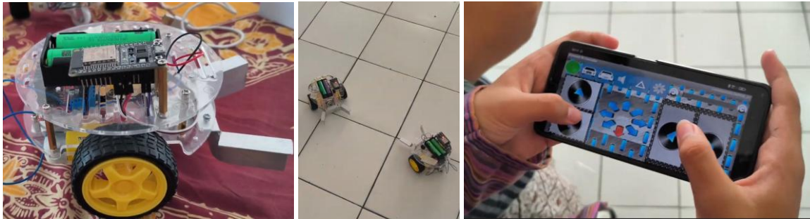
Gambar 3. Demonstrasi dan uji coba robot soccer berbasis Arduino oleh siswa.

terlihat dari banyaknya pertanyaan yang diajukan siswa terkait proses pembuatan, biaya, dan tingkat kesulitan pengembangan robot.