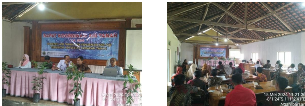
Gambar 2. Tahapan penyampaian materi sosialisasi

Upaya konkret untuk mendukung peningkatan pemahaman masyarakat tentang gerakan tanah, salah satunya adalah dengan sosialisasi gerakan air tanah. Pemahaman tersebut akan membekali masyarakat guna mencegah gerakan tanah di daerahnya.