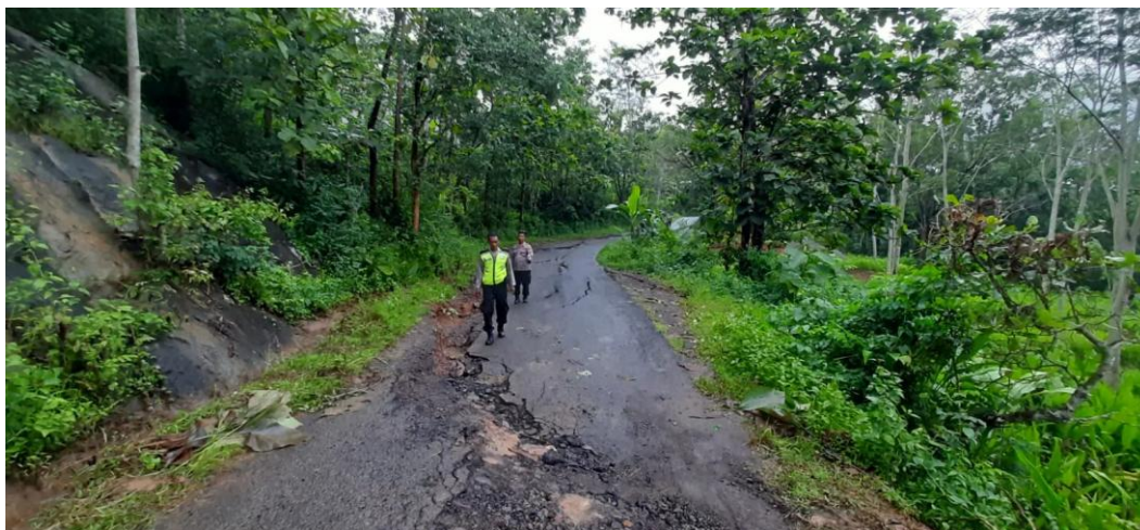
Gambar 3. Gerakan tanah yang terjadi di Jalan Ngambarsari pada bulan Maret 2023 (Arianto, 2023)

Retakan pada batuan juga memengaruhi gerakan. Semakin banyak retakan pada batuan, potensi terjadinya gerakan tanah juga semakin tinggi. Kondisi batuan yang ada di Desa Ngambarsari terlihat banyak retakan.