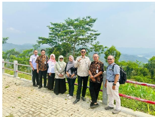
Gambar 4. Peninjauan lapangan kondisi morfologi, batuan dan vegetasi

Setelah pelaksanaan sosialisasi dilanjutkan dengan peninjauan lapangan kondisi morfologi, batuan, vegetasi (Gambar 4). Berdasarkan hasil peninjauan terlihat bahwa morfologi yang ada di Desa Ngambarsari berlereng curam dengan kemiringan berkisar 30^{\circ} - 40^{\circ} . Batuan yang ada mengalami pelapukan yang sangat intensif menjadi tanah, di beberapa tempat masih banyak lahan terbuka atau kurangnya tanaman penutup walaupun ada berupa semak dan berupa tegalan. Kondisi inilah yang menyebabkan bahwa seringnya gerakan tanah pada waktu musim penghujan.