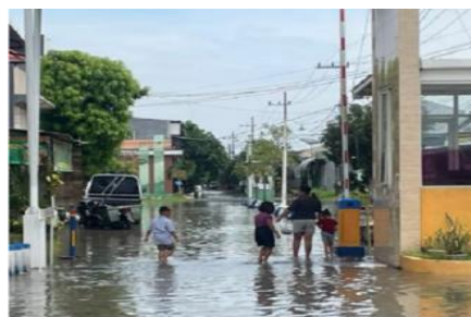
Gambar 2 Genangan air pasca banjir

Kondisi ini diperburuk oleh faktor sosial, yaitu rendahnya kesadaran masyarakat terhadap pengelolaan saluran air. Data survei awal menunjukkan bahwa 95,6% warga memiliki kebiasaan membuang sampah ke saluran drainase, dan belum pernah ada koordinasi pemeliharaan antarwarga. Sebelum program ini dilaksanakan, upaya penanganan banjir yang pernah dilakukan warga masih bersifat individual dan reaktif, seperti membuat selokan sederhana di depan rumah masing-masing tanpa memperhatikan keterhubungan antar segmen. Pemerintah kelurahan dan kecamatan pun belum memiliki program khusus untuk penataan drainase di kawasan ini. Sistem drainase yang ada bersifat parsial dan tidak terintegrasi antarsegmen perumahan, sehingga kapasitas tampung dan aliran air tidak optimal. Permasalahan ini sejalan dengan temuan (Suripin, 2004) yang menyatakan bahwa pengelolaan drainase perkotaan memerlukan pendekatan terpadu yang melibatkan aspek teknis, sosial, dan kelembagaan secara simultan (Rahman & Setyawan, 2023). Genangan air pasca-hujan di persimpangan RT 31 pada akhir Januari 2026, dengan kedalaman 15-20 cm dan durasi 2,5 jam yang terlihat pada gambar 2.