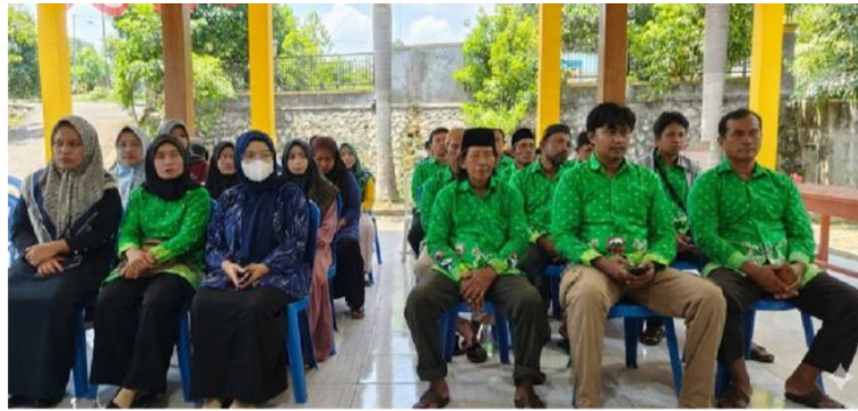
Gambar 4 Edukasi dan pelatihan

teknik pembuatan saluran sederhana, dan manajemen sampah untuk mencegah penyumbatan saluran.