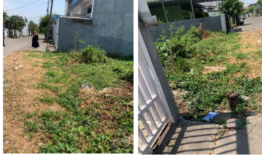
Gambar 1 Kondisi Eksisting Saluran Drainase Yang Tidak Terintegrasi

genangan dan banjir yang berulang setiap musim hujan (Amali et al., n.d.). Berdasarkan survei lapangan yang dilakukan pada Oktober 2025, lebih dari 80% dari 100 rumah di RT 30, RT 31, dan RT 32 tidak memiliki saluran drainase yang terhubung dengan sistem pembuangan utama. Kondisi ini menyebabkan air hujan tergenang selama rata-rata 3 jam pada setiap kejadian hujan deras dengan kedalaman mencapai 15-20 cm di titik-titik kritis seperti persimpangan antar blok perumahan. Pada gambar 1 menunjukkan hanya sebagian rumah memiliki selokan sederhana yang tidak terhubung.