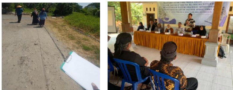
Gambar 3 Survei kondisi eksisting dan koordinasi awal

Pelaksanaan program terbagi dalam empat tahapan utama. Tahap pertama adalah perencanaan dan pemetaan (Oktober 2025) yang meliputi survei kondisi eksisting saluran drainase (Gambar 3), identifikasi titik-titik genangan kritis, serta penyusunan peta jaringan drainase menggunakan GPS dan drone mapping . Seluruh warga di ketiga RT terlibat dalam penyediaan akses dan informasi lapangan, sementara pengurus RT/RW dan tokoh masyarakat berperan dalam koordinasi awal dan pembangunan komitmen bersama. Pada tahap ini juga dilakukan koordinasi awal dengan pengurus RT/RW dan tokoh masyarakat.