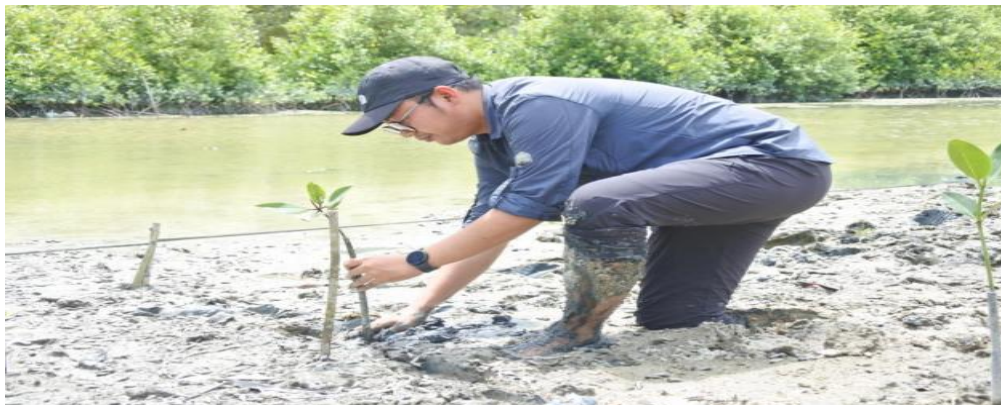
Gambar 4. Penanaman mangrove dengan pola penanaman tunggal