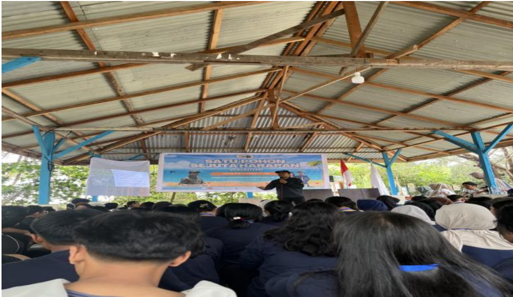
Gambar 2. Sosialisasi dan pemberian materi kegiatan penanaman mangrove