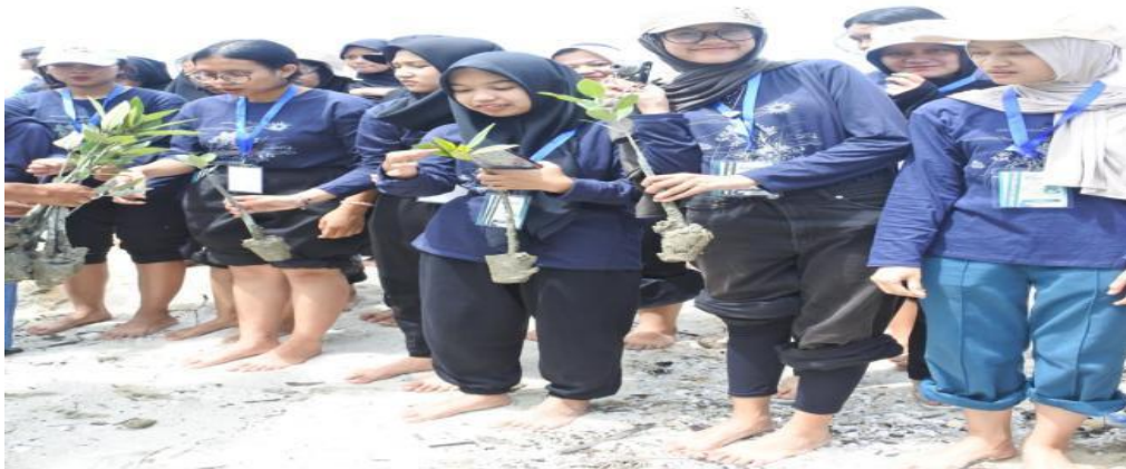
Gambar 3. Persiapan penanaman mangrove yang dilakukan oleh volunteer