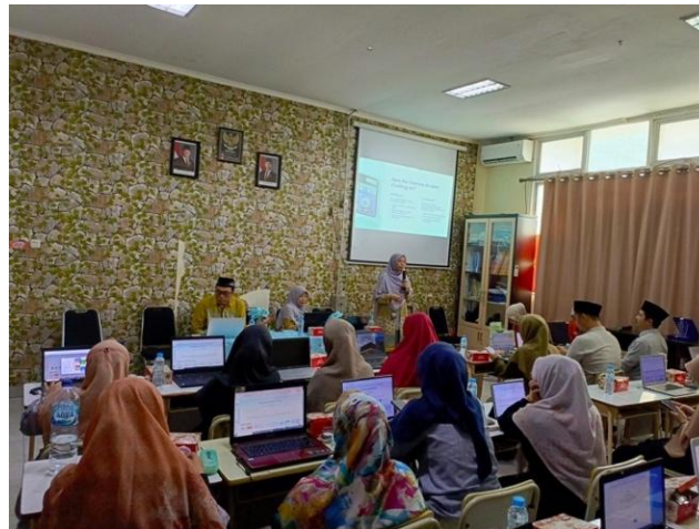
Gambar 2. Dokumentasi Pelaksanaan Hands-on Workshop dan Pendampingan Klinis Pemanfaatan Fitur Canva AI

Proses asistensi dan pendampingan klinis dilakukan secara personal di sela-sela simulasi oleh tim pengabdian guna meminimalisasi hambatan operasional serta meluruskan alur logika ( logic flow ) guru saat menyusun navigasi website pembelajaran dua arah berbasis Coding AI . Melalui pendekatan pengajaran yang bersifat sirkular dan interaktif ini, proses transfer keilmuan dan diseminasi teknologi berjalan secara organik. Dokumentasi ini menjadi bukti empiris kuat bahwa keterlibatan aktif secara langsung di lapangan mampu mengikis kecemasan teknologi ( technophobia ) pada guru serta mengakselerasi kemandirian mereka dalam memproduksi bahan ajar interaktif yang tervalidasi untuk kebutuhan satu semester berjalan.