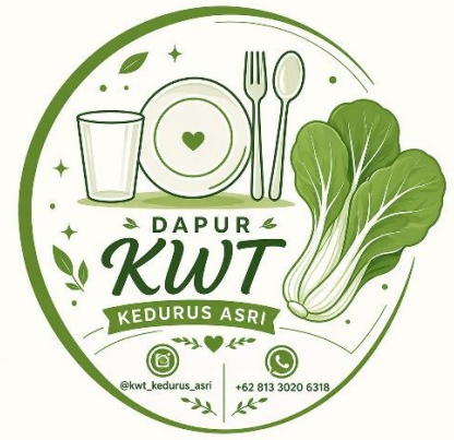
Gambar 4. Logo Turunan Produk KWT Sebelum Gambar 5. Logo Turunan Produk KWT Sesudah

Logo versi baru (sesudah) beralih fokus menjadi "Dapur KWT Kedurus Asri" setelah mengalami transformasi, mencerminkan langkah strategis kelompok menuju hilirisasi atau pengolahan produk kuliner berbasis hasil tani. Visualisasi diubah secara total menjadi lebih modern, bersih, dan berorientasi pada industri pangan konsumen dengan mengintegrasikan ilustrasi peralatan makan seperti piring berlogo hati, sendok, garpu, gelas, serta seikat sayur pakcoy segar yang ikonik. Skema warna hijau yang digunakan memberikan kesan yang lebih harmonis, profesional, dan organik. Tata letak tipografinya pun menjadi jauh lebih seimbang dengan penyertaan akun media sosial resmi (@kwt_kedurus_asri) dan nomor WhatsApp yang rapi, sehingga meningkatkan daya saing visual, kemudahan pengenalan merek (brand recognition), serta kepraktisan saat diaplikasikan pada label kemasan produk olahan mereka.