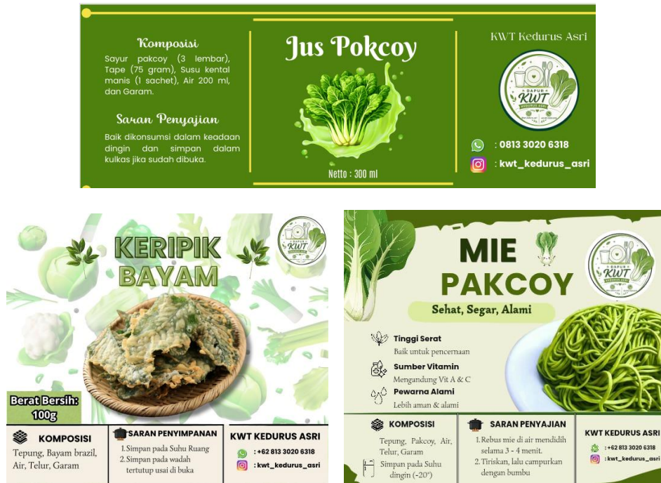
Gambar 6. Kemasan Produk

Pada indikator pengembangan kemasan produk diperoleh nilai rata-rata sebesar 3,73 atau 93,18% dengan kategori sangat tinggi. Hal ini menunjukkan bahwa peserta menilai kegiatan pendampingan mampu memberikan pemahaman mengenai pentingnya kemasan sebagai salah satu faktor yang memengaruhi keputusan pembelian konsumen. Perubahan desain kemasan tidak hanya meningkatkan nilai estetika produk, tetapi juga memberikan informasi yang lebih lengkap mengenai produk sehingga dapat meningkatkan kepercayaan konsumen. Dengan demikian, kemasan berfungsi sebagai media komunikasi sekaligus strategi pemasaran yang mendukung peningkatan daya saing produk lokal.