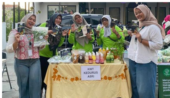
Gambar 8. Dokumentasi

Indikator kebermanfaatan program memperoleh nilai rata-rata sebesar 3,79 atau 94,70%, yang merupakan nilai tertinggi di antara seluruh indikator dan termasuk kategori sangat tinggi. Tingginya penilaian tersebut menunjukkan bahwa peserta merasakan manfaat yang signifikan dari kegiatan pendampingan yang telah dilaksanakan. Program tidak hanya meningkatkan pemahaman anggota KWT mengenai branding, kemasan, dan pemasaran digital, tetapi juga memberikan motivasi untuk terus mengembangkan produk yang dimiliki agar memiliki nilai tambah dan mampu bersaing di pasar yang lebih luas.