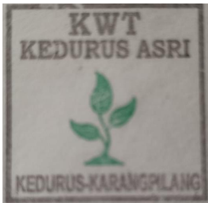
Gambar 2. Logo KWT Sebelum

Identitas visual yang diterapkan pada logo, label produk, dan media promosi memperkuat citra KWT Kedurus Asri sebagai kelompok usaha yang lebih profesional dan memiliki karakter yang mudah dikenali oleh konsumen. Penerapan identitas visual yang seragam pada berbagai media menciptakan kesan yang lebih kredibel sekaligus meningkatkan nilai tambah produk di mata masyarakat. Temuan ini sejalan dengan konsep community branding oleh Palupisari & Wibawa (2026) yang menekankan bahwa identitas visual berperan sebagai representasi nilai, karakter, dan keunikan suatu komunitas sehingga mampu memperkuat posisi kelompok dalam menghadapi persaingan pasar. Peningkatan pemahaman tersebut menunjukkan bahwa pendampingan identitas visual tidak hanya menghasilkan logo baru, tetapi juga membangun kapasitas anggota KWT dalam mengelola citra merek secara berkelanjutan (Sayekti et al. , 2026)