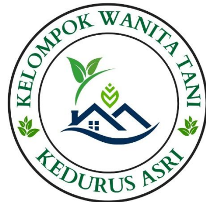
Gambar 3. Logo KWT Sesudah

Logo sebelum menampilkan bentuk tanaman sederhana berwarna hijau dengan tipografi yang kurang proporsional dan visual yang tampak kurang jelas. Desain tersebut belum mencerminkan identitas kelompok secara utuh, memiliki keterbatasan dalam hal daya tarik visual, serta kurang mampu menghadirkan kesan profesional. Elemen visual yang minimalis tanpa komposisi yang kuat juga membuat logo sulit dikenali dan kurang komunikatif ketika diaplikasikan pada berbagai media.