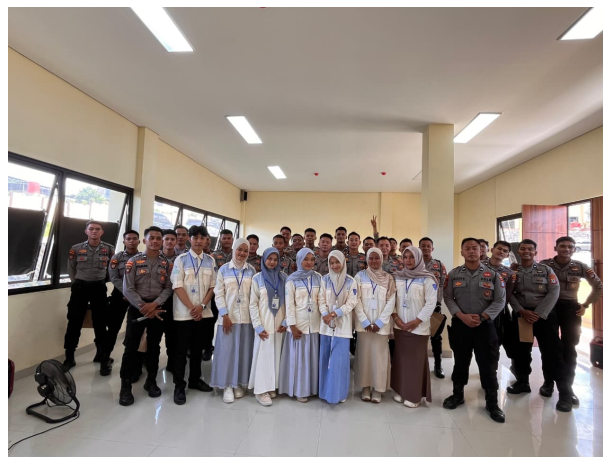
Gambar 4. Dokumentasi Bersama Personel Samapta

Sebagai bentuk implementasi teori behaviorisme melalui pendekatan positive reinforcement (penguatan positif), tim pengabdian memberikan cenderamata kepada seluruh peserta yang berpartisipasi, serta reward (hadiah) khusus bagi peserta yang berani mengajukan diri secara sukarela pada sesi sharing dan pemenang yel-yel . Pengisian lembar kertas evaluasi tertulis ini kemudian ditutup dengan pengumpulan berkas kepada tim pengabdian sebelum seluruh rangkaian acara diakhiri dengan dokumentasi bersama di lapangan, seperti yang ditampilkan pada Gambar 4.