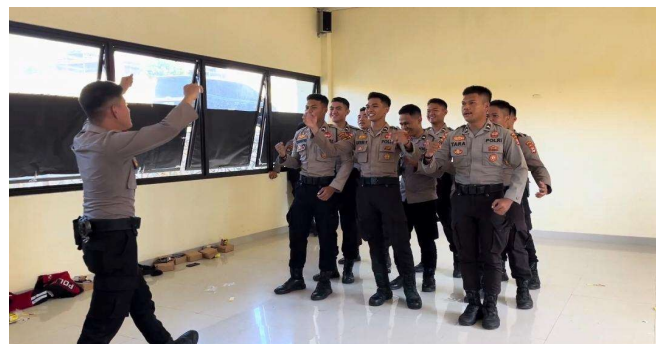
Gambar 2. Aktivitas Kerja Kelompok dan Kompetisi Positif Personel Samapta