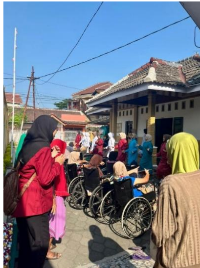
Gambar 2. Kegiatan Senam Bersama Lansia

Kehadiran berbagai kegiatan di panti jompo sangat bermakna bagi kesehatan fisik maupun psikologisnya, dalam hal ini dimulai dari kegiatan senam yang dilaksanakan sebagai kegiatan awal bagi para lansia. Penelitian terdahulu menunjukkan bahwa kegiatan senam yang dilaksanakan oleh para lansia bukan hanya sekedar peningkat suasana hati namun dengan dilaksanakannya senam para lansia akan merasa lebih rileks, penurunan kecemasan, menjaga kebugaran tubuh, menambah interaksi dengan teman penghuni yang lain, dan mampu menurunkan tingkat kebosanan dengan aktivitas di lingkungan terbuka (Hadjarati et al., 2024; Mulyadi & Daud, 2025; Putro & Mariyati, 2024). Kegiatan tersebut disajikan pada Gambar 2.