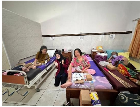
Gambar 3. Dokumentasi Sesi Life Review pada Lansia

Kegiatan art painting juga menjadi salah satu yang paling digemari oleh para lansia pada kegiatan psikoedukasi, hal tersebut dikarenakan cukup banyak peserta yang mengaku suka dan bahagia saat diminta menyalurkan keinginan dalam melukis. Kegiatan art painting terbukti dapat menurunkan stres, mengurangi kesepian, melatih motorik halus, dan menjadi penyaluran emosi pada lansia (Elisnawati & Agustin, 2025; Putri et al., 2025). Pada kegiatan art painting para peserta menyalurkan aktivitas, benda, hingga pekerjaan yang disukai dalam bentuk lukisan, hal tersebut tercermin bukan hanya dari lukisan namun juga cerita yang tersampaikan saat kegiatan art painting berlangsung. Dokumentasi kegiatan art painting disajikan pada Gambar 4.