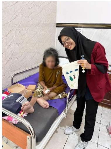
Gambar 4. Kegiatan Art Painting pada Lansia

Kegiatan art painting juga menjadi salah satu yang paling digemari oleh para lansia pada kegiatan psikoedukasi, hal tersebut dikarenakan cukup banyak peserta yang mengaku suka dan bahagia saat diminta menyalurkan keinginan dalam melukis. Kegiatan art painting terbukti dapat menurunkan stres, mengurangi kesepian, melatih motorik halus, dan menjadi penyaluran emosi pada lansia (Elisnawati & Agustin, 2025; Putri et al., 2025). Pada kegiatan art painting para peserta menyalurkan aktivitas, benda, hingga pekerjaan yang disukai dalam bentuk lukisan, hal tersebut tercermin bukan hanya dari lukisan namun juga cerita yang tersampaikan saat kegiatan art painting berlangsung. Dokumentasi kegiatan art painting disajikan pada Gambar 4.