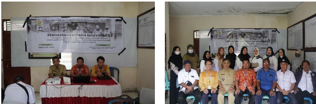
Gambar 3. Persiapan dan pembukaan kegiatan

Pada tahap ini tim melakukan persiapan untuk kegiatan pelaksanaan, seperti kegiatan pembuatan modul kegiatan, persiapan administrasi dan pembuatan banner. Selain itu persiapan dan pembukaan kegiatan juga dilakukan di lokasi seperti pada Gambar 3