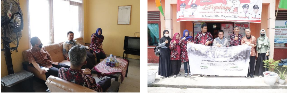
Gambar 2. Diskusi bersama tim kelurahan

Pada bagian ini, tim dosen bersama mahasiswa melakukan survei ke lokasi untuk memastikan lokasi tempat pelaksanaan. Tujuan dari kegiatan ini adalah untuk mendiskusikan bersama kepala lurah tentang waktu dan tempat pelaksanaan kegiatan. Seperti terlihat pada Gambar 2.