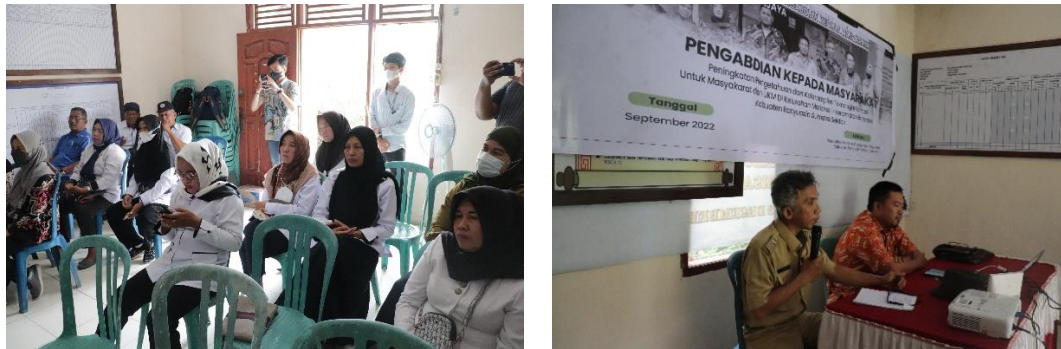
Gambar 4. Kegiatan penyampaian materi