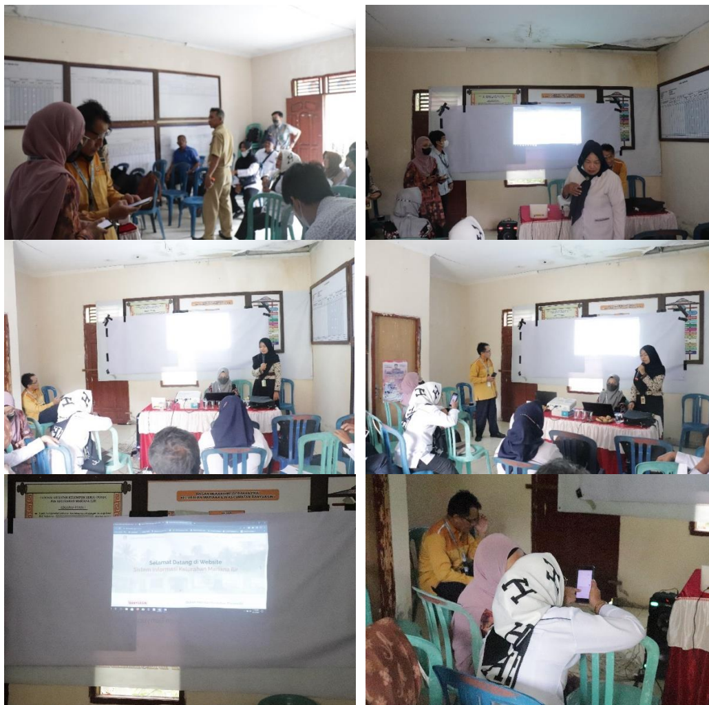
Gambar 5. Kegiatan Pendampingan dan demonstrasi prgram TIK

Pada tahap ini, tim pelaksana melakukan pendampingan dan demonstrasi program kepada peserta. Aplikasi TIK yang didemontasikan adalah sebagai berikut: https://marianailir.org/ . Dengan aplikasi tersebut akan terjadi penyampaian informasi yang efisien. Baik dari kelurahan atau dari masyarakat. Aplikasi tersebut merupakan salah satu hibah yang diberikan oleh tim kepada kelurahan dan masyarakat sebagai mediasi penyampaian informasi. Pada kegiatan ini seperti terlihat pada Gambar 5.