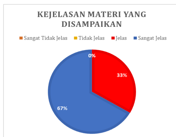
Gambar 10. Hasil kuesioner tentang kejelasan materi

Setelah melakukan pelatihan selama dua hari (17-18 Desember 2022), tim pengabdian kepada masyarakat menyebarkan kuesioner evaluasi untuk mengetahui kejelasan materi yang telah disampaikan, kebermanfaatannya, dan penerapan materi pelatihan bagi mitra pengabdian kepada masyarakat ditunjukkan pada Gambar 10, Gambar 11, dan Gambar 12.