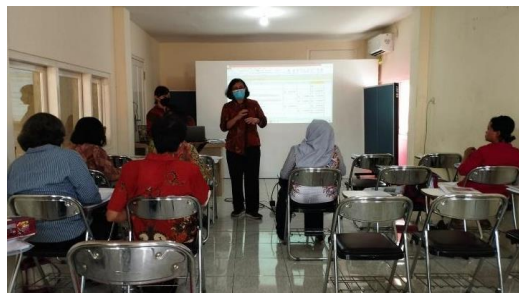
Gambar 1. Pelaksanaan pelatihan secara luring pada 17 Desember 2022

Pendampingan bagi anggota CU Prima Danarta usaha dagang menuju terampil pencatatan transaksi dan perpajakan dilakukan dua sesi. Sesi pertama dilakukan pada Sabtu, 17 Desember 2022. Materi yang disampaikan dalam sesi pertama asumsi dasar akrual, kelangsungan usaha, konsep entitas bisnis, dan pengenalan aset, kewajiban, modal, pendapatan, beban, laporan laba rugi, serta neraca. Peserta diberikan kesempatan untuk bertanya terkait materi yang disampaikan. Gambar 1 menunjukkan tim abdimas sedang menjawab pertanyaan dari salah satu peserta mengenai penarikan uang oleh pemilik usaha akan mempengaruhi usaha karena akan mengurangi modal usaha mereka.