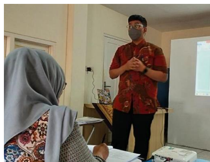
Gambar 2. Pelaksanaan pelatihan secara luring pada 17 Desember 2022

Gambar 2 menunjukan aktivitas penjelasan terkait penilaian persediaan metode perpetual FIFO/MPKP ( first in first out /masuk pertama keluar pertama) dan rata-rata ( average ). Materi ini dipilih karena mayoritas peserta adalah jenis usaha dagang. Peserta juga diberikan kasus untuk mempelajari cara melakukan penilaian persediaan. Selama sesi tersebut, beberapa peserta bertanya “Mengapa kos dari persediaan tidak sesuai dengan harga jual?” dan tim abdimas memberikan jawaban bahwa kos persediaan berasal dari harga beli atau harga perolehan persediaan yaitu semua pengorbanan yang dikeluarkan untuk memperoleh persediaan tersebut sampai siap untuk dijual.