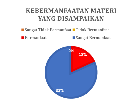
Gambar 11. Hasil kuesioner tentang kebermanfaatan materi

Berdasarkan Gambar 11 diketahui bahwa 82% peserta menyatakan bahwa materi yang disampaikan oleh tim pengabdian kepada masyarakat sangat bermanfaat bagi usaha yang mereka miliki. Hal ini dikarenakan materi akuntansi, keuangan, dan perpajakan yang disampaikan oleh tim pengabdian kepada masyarakat mudah dipahami dan ditunjang dengan kasus transaksi yang dapat membantu peserta untuk berpraktik. Selain itu, kebermanfaatan materi juga dirasakan karena pemahaman tentang akuntansi dan perpajakan juga sangat diperlukan oleh peserta di setiap jenis usaha.