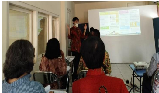
Gambar 3. Pelaksanaan pelatihan secara luring pada 17 Desember 2022

Dalam sesi Sabtu, 17 Desember 2022, tim abdimas juga memperkenalkan pajak penghasilan dan PPN untuk UMKM beserta penghitungan dan pelaporannya. Peserta dijelaskan terkait ketentuan pajak penghasilan bagi UMKM, PPN, dan tata cara pelaporan perpajakan. Gambar 3 menunjukkan pelaksanaan pemaparan dan tanya jawab terkait materi perpajakan.