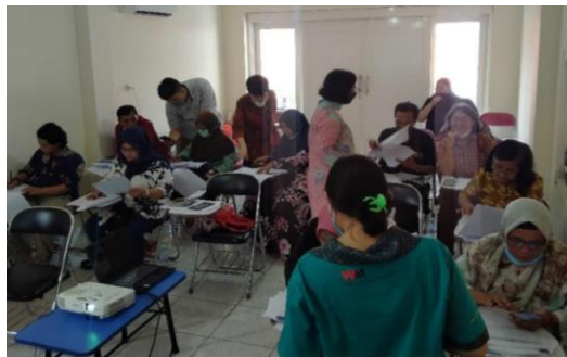
Gambar 4. Pelaksanaan pelatihan secara luring pada 18 Desember 2022

Gambar 4 menunjukkan kondisi peserta saat mengerjakan kasus transaksi November dengan didampingi oleh tim abdimas. Dalam pendampingan tersebut masih ditemui adanya beberapa kesalahan pencatatan transaksi. Semua transaksi November telah dicatat di pos akun yang tersedia, tim abdimas memeriksa kembali setiap saldo akun sebelum pembuatan laporan keuangan. Jika sudah sesuai, peserta melanjutkan membuat laporan laba rugi, dan laporan posisi keuangan (neraca) untuk November 2022.